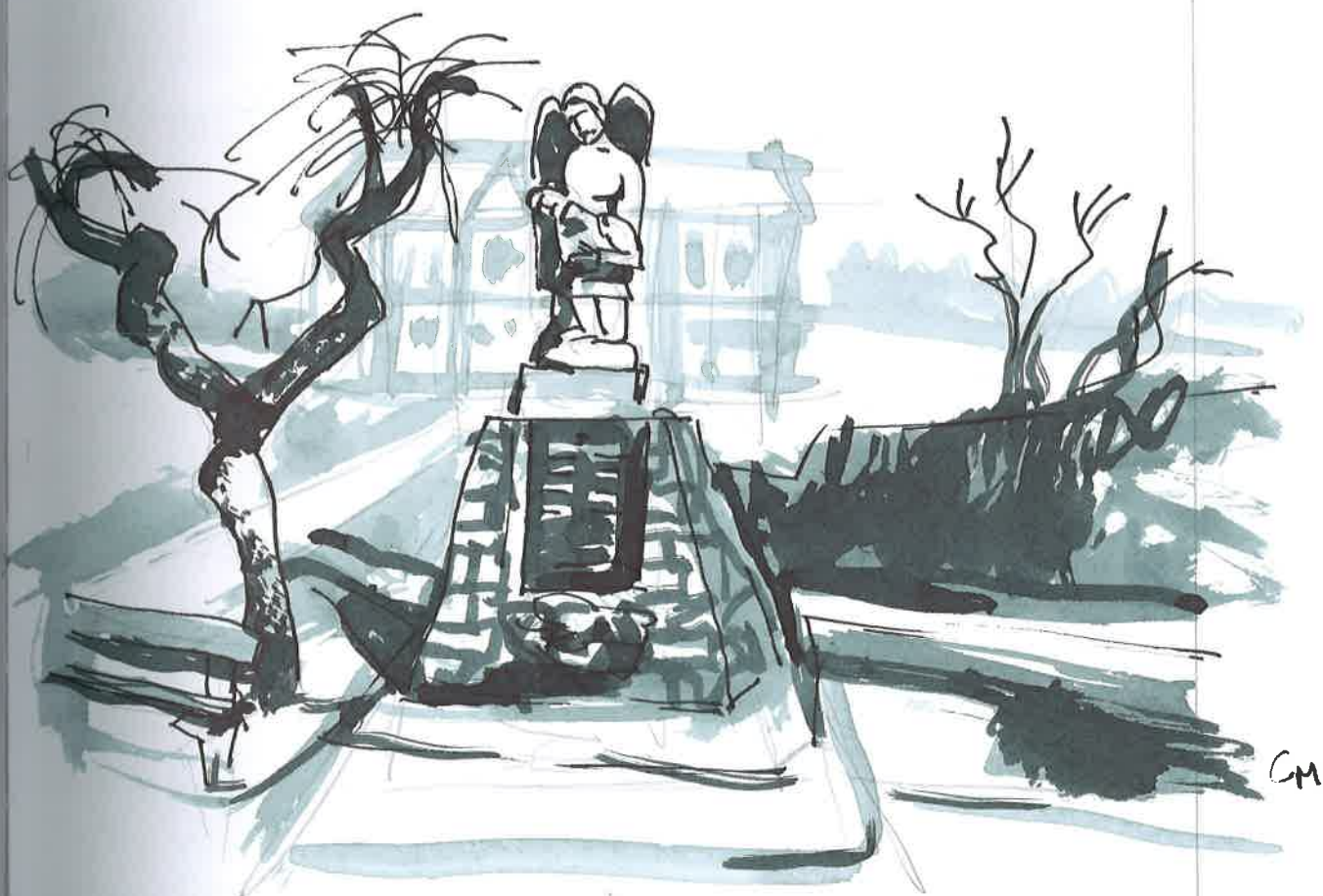
POPNÍK V POTEČI

3. prosince napadl zase poprášek sněhu a celý den mráček - 2°C. Nejnižší mráz - 18°C byl 8. a 9. prosince, pak zase holm - 8°C. Vánoce byly pod nohama na ledě, ale mráz nebyl, jen holm nuly.