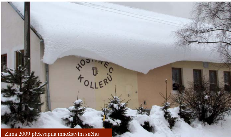
Zima 2009 překvapila množstvím sněhu

Když vyšel obecní zpravodaj v loňském roce, tak jsem se jako předsedkyně ČČK zlobila, že v něm není nikde ani zmínka o Červeném kříži. Jako kdyby v Poteči tato organizace neexistovala. Přitom jsme ten rok pořádali několik akcí, které stály za to a všem se líbily. Letos mě oslovili z obce - „napište si nějaký článek, aby se o vás vědělo!“