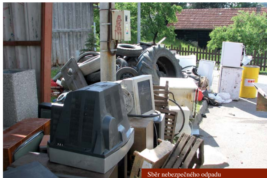
Sběr nebezpečného odpadu

dech, ve kterých má obec uloženy své rezervy a víra v rychlý obrat byla ztracena. Přemístila své peníze na méně rizikové účty, přesto ztratila celkem 117 tisíc.