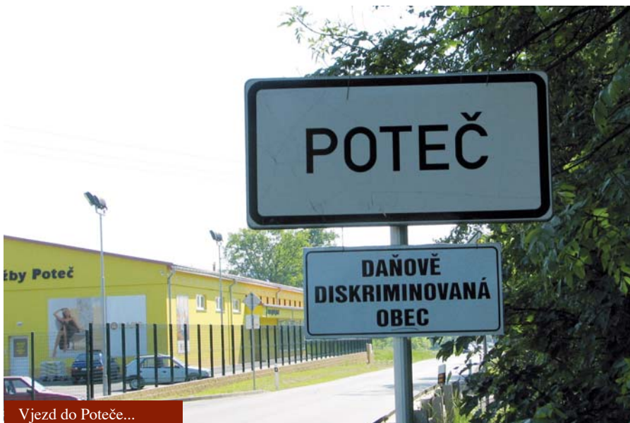
Vjezd do Poteče...

Obce žijí a hospodaří hlavně z vybraných daní. DPH, daň z příjmu právnických osob a daň z mezd zaměstnanců činí 92 % příjmů naší obce. Finanční úřad vybere tyto daně za celý stát a rozdělí je mezi státní rozpočet - 69,68 %; obec a města - 21,4 % a kraje - 8,92 %. Podíl pro města a obce je rozdělen podle počtu obyvatel upravených koeficientem. Kámen úrazu je v tom koeficientu, který na jednoho obyvatele velkých měst je