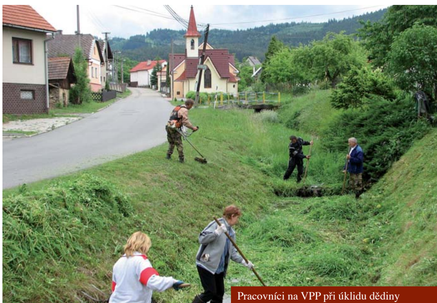
Pracovníci na VPP při úklidu dědiny