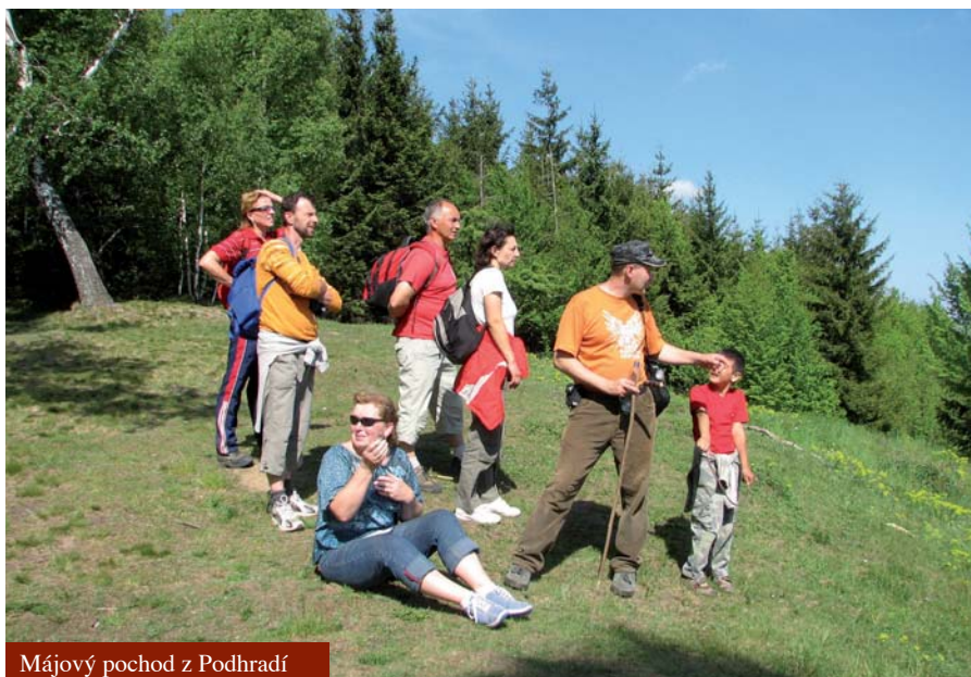
Májový pochod z Podhradí