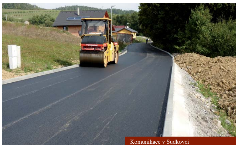
Komunikace v Sudkovci