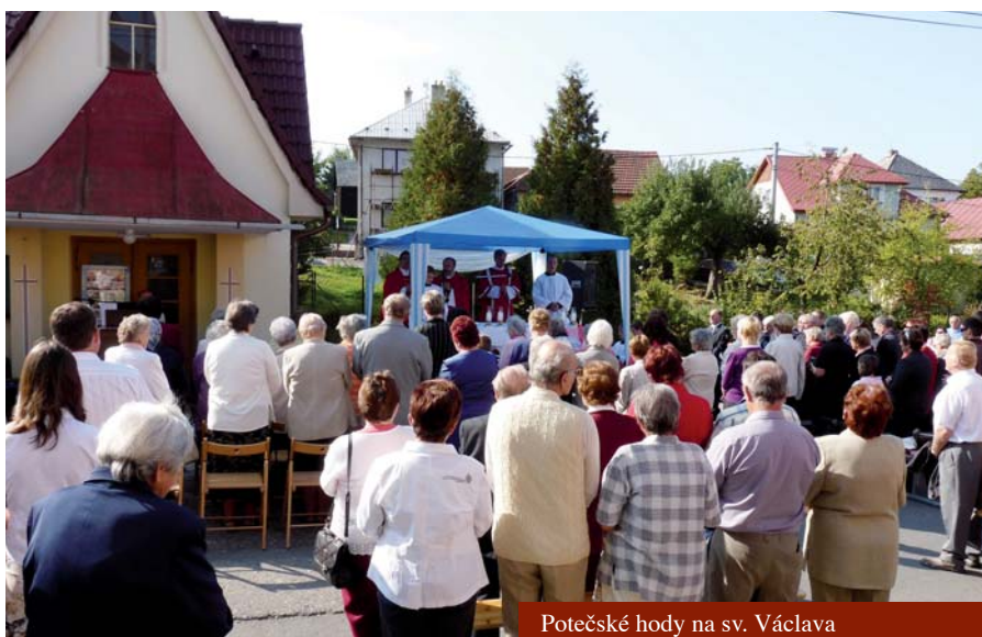
Potečské hody na sv. Václava

Ke ščukotání se používá dřevěná ščukotačka, tragač – někdo z našich tatínků a dědečků to umí i vyrobit.