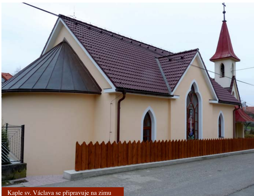
Kaple sv. Václava se připravuje na zimu