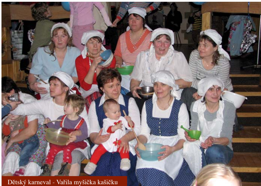
Dětský karneval - Vařila myšička kašičku

Svěcení připadlo na prvního května. Už celý týden se finišovalo, opravdu čilý