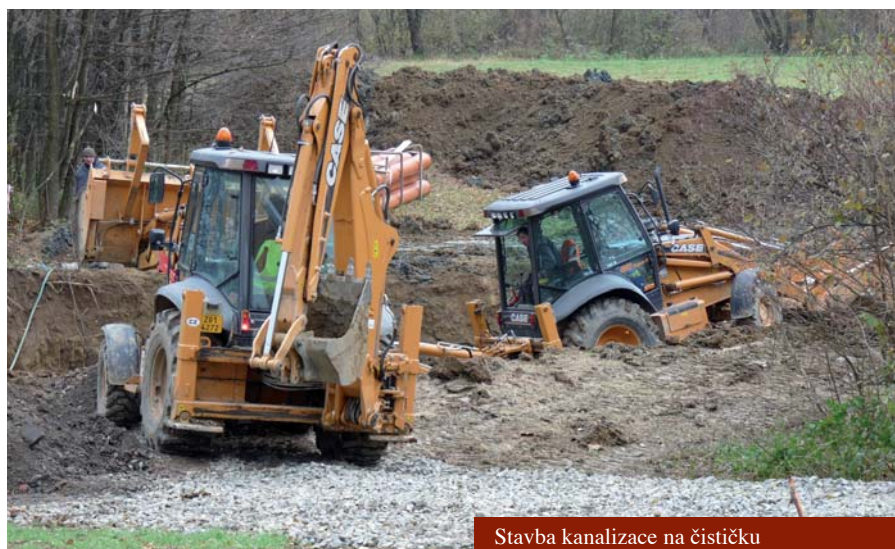
Stavba kanalizace na čističku