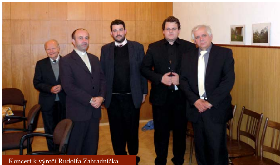
Koncert k výročí Rudolfa Zahradníčka