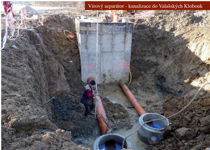
Vírový separátor - kanalizace do Valašských Klobouk

tříkrát větší než na obyvatele malých obcí. Ministerstvo financí proto zadalo zpracovat vysokým ekonomickým školám rozbor potřeb pro různě veliké sídla a došlo se k závěru, že větší města mají opravdu více nákladů na zajištění regionálních funkcí a jejich náklady jsou vyšší až dvakrát než u malých obcí. Dále z této studie vyplývá, že Praha, Brno, Ostrava a Plzeň mají více než by jim příslušeno na úkor všech ostatních. Na jaře však padla vláda a spravedlivější rozdělení daní bylo odloženo na neurčito. Poteč je součástí Sdružení místních samospráv, které zastupuje menší města o obce při jednáních s poslanci a vládou. Akce vyvěšení „Daňově diskriminovaná obec,“