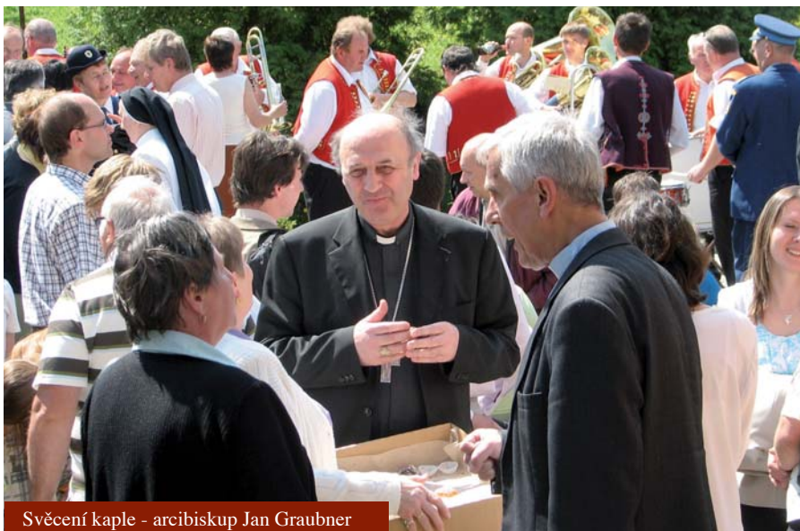
Svěcení kaple - arcibiskup Jan Graubner

• U příležitosti svěcení kaple byla vydána ve spolupráci s Římskokatolickou farností Valašské Klobouky propagační brožura.