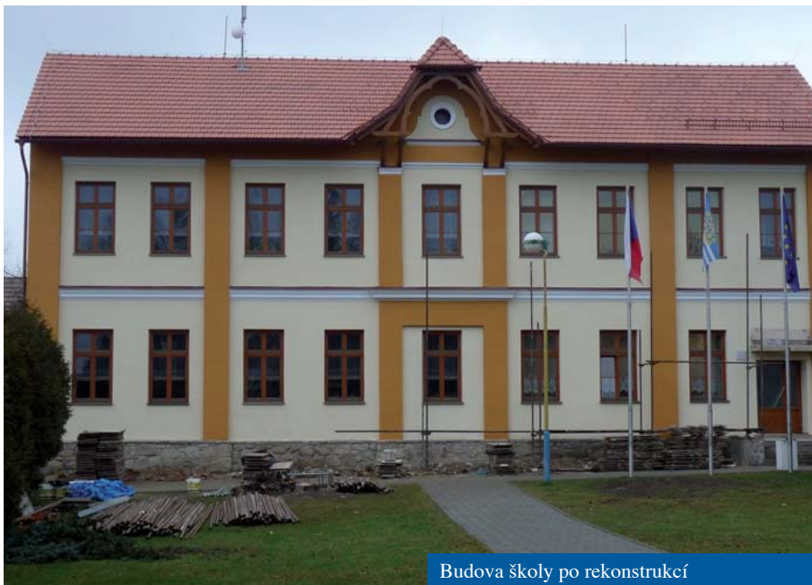
Budova školy po rekonstrukci

sousedskými spory, kterých je stále dost, ale chtěl bych tady psát o jiných prohrěškoch. Když někdy vyjdu na ulici a pozoruji komíny, jak se z nich valí černý a štiplavý dým a přitom máme plyn, tak je mi z toho smutno. Každý by měl občas vyjít před svůj dům a podívat se, co se mu valí z komína. Víím, že plyn je drahý a než se kotel roztopí, tak to chvíli zakouří. Nemělo by to však být stále. A ten, kdo pálí plasty, hazarduje se zdravím nás všech, protože kouř ze spalování je jedovatý. Z trestáním hříšníků je problém, ale věřím, že si všichni dáte pozor na to co pálíte a jak to pálíte a situace se zlepší!