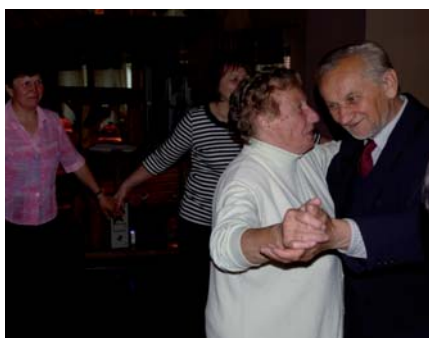
Beseda s důchodci