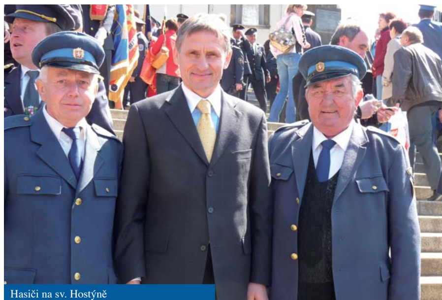
Hasiči na sv. Hostýně

• 15. července 2010 navštívila naši obec komise, protože Poteč se přihlásila do soutěže Vesnice roku. Nejdříve si z auta prohlédli celou dědinu, potom si šli prohlédnout nově přistavenou kapliče-