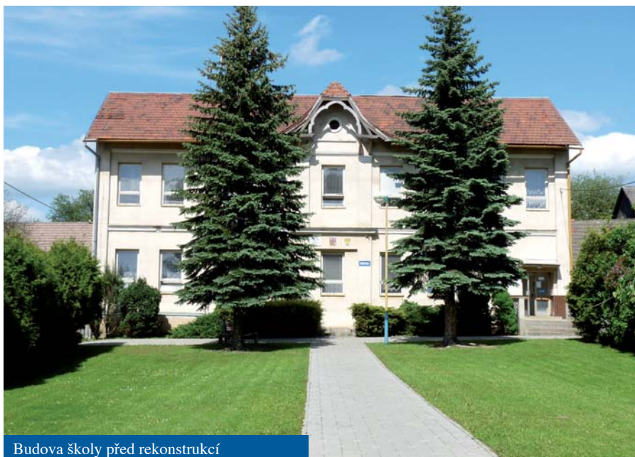
Budova školy před rekonstrukcí

Domnívám se, že všechny i drobné stavby jsou pro naše občany potřebné. Míra potřebnosti je však nepřímo úměrná vzdálenosti od probíhající stavby. Zvolené zastupitelstvo a rada pak vždy zvažuje finanční náročnost, potřebnost a připravenost staveb. Nejdůležitější rozhodování pak probíhá při schvalování ročního rozpočtu začátkem roku.