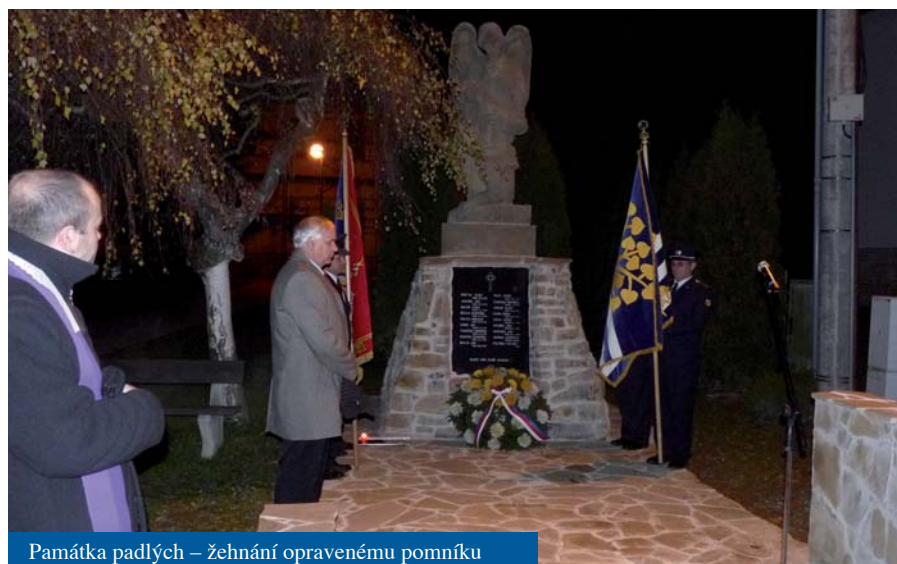
Památka padlých – žehnání opravenému pomníku

- Postavení nového víceúčelového hřiště pro děti a generální oprava kabin TJ se nepodařilo zatím realizovat.