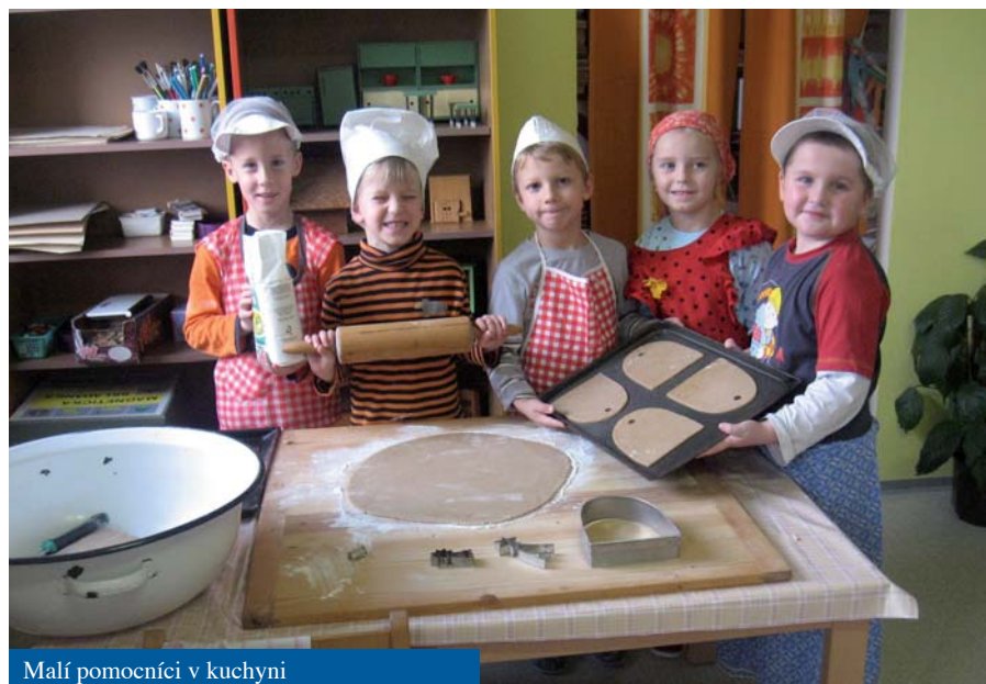
Malí pomocníci v kuchyni