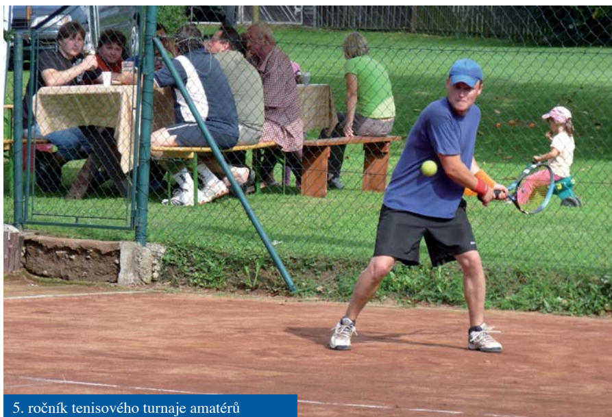
5. ročník tenisového turnaje amatérů

• 22. srpna, na svátek Panny Marie Královny byla sloužena mše svatá na