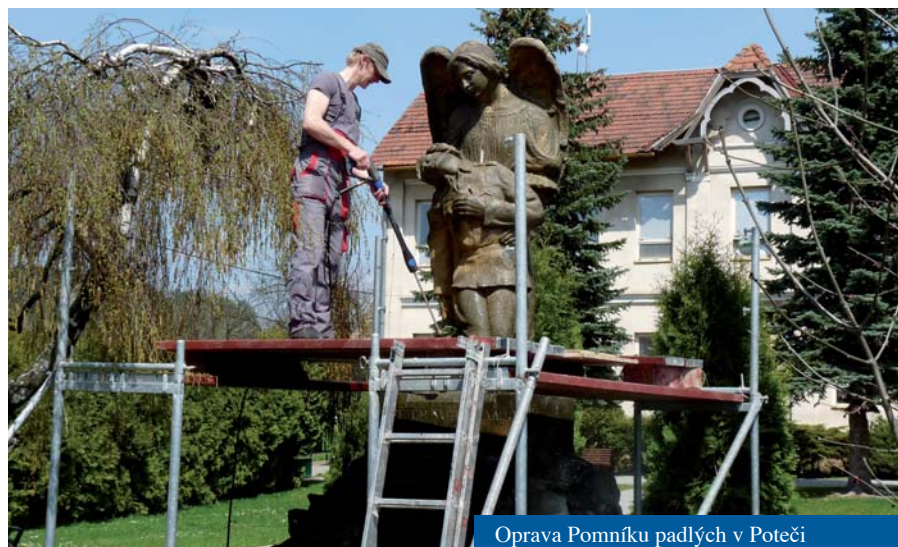
Oprava Pomníku padlých v Poteči