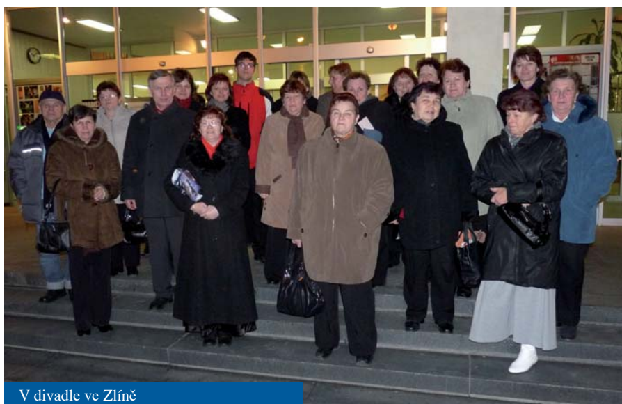
V divadle ve Zlíně