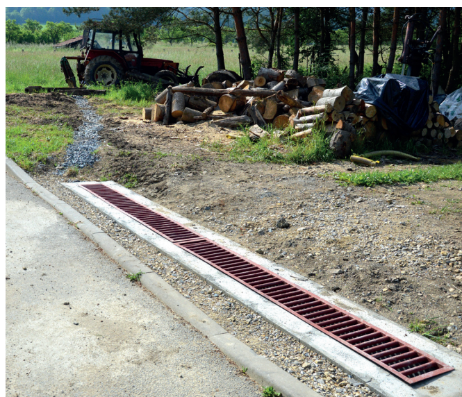
Povrchové vody u Polanských