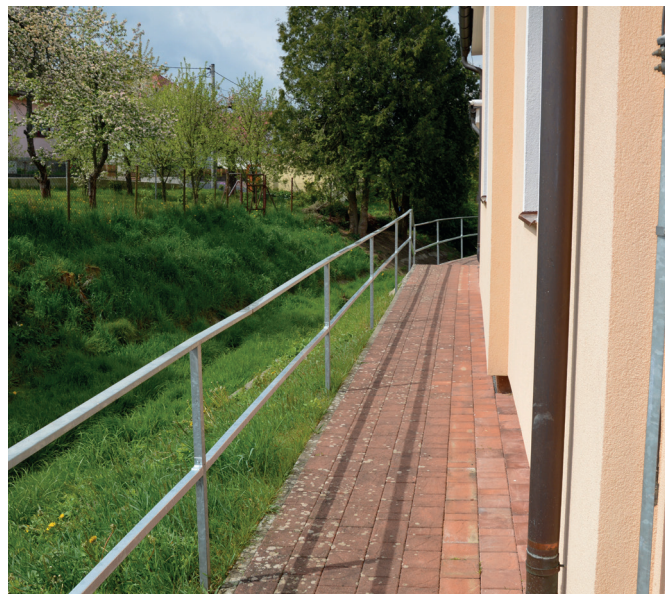
Oplocení u kaple

V květnu jsme realizovali u Polanských a Řezníků lapač povrchové vody, který přilehlou zástavby trápil již nespočet let. Materiál nás stál 14 tis. Kč, práce se bude fakturovat až po uzávěrc zpravodaje.