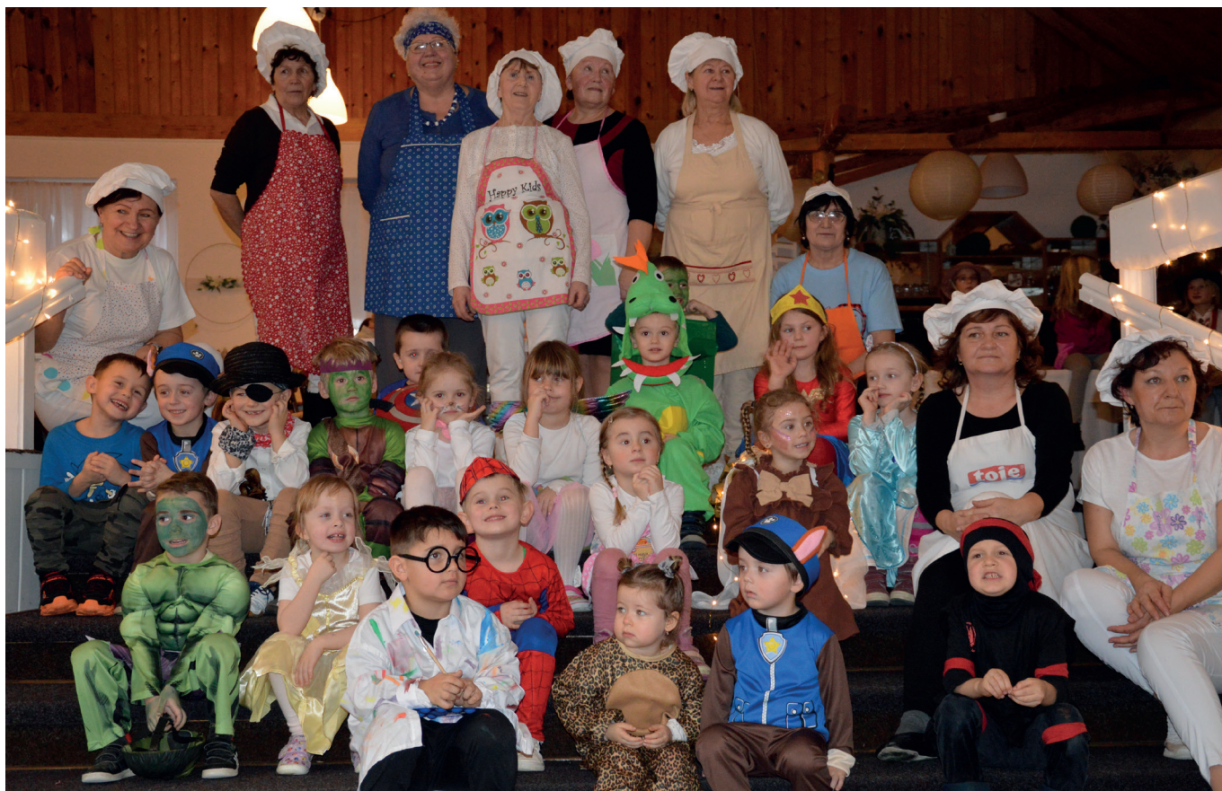
Karneval v maskách