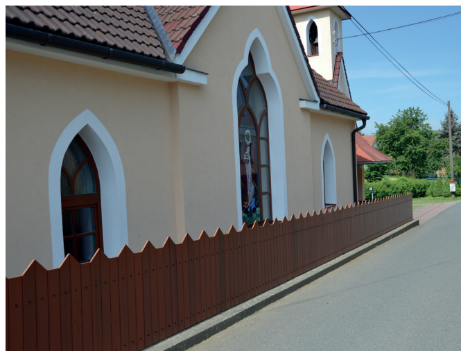
Oplocení u kaple