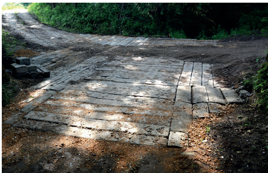
podjezd v Rakovém