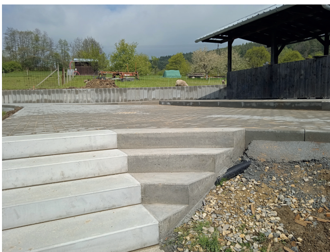
Propojovací chodník FK