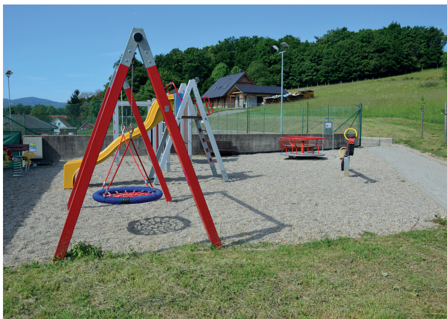
dětské hřiště v areálu FK

stala tak plnit svou funkci. Rybičky máme od jednoho občana příslibem, jenže bez vypuštění domácího jezírka nejdou chytit. Prosíme o strpení, rybičky opět budou.