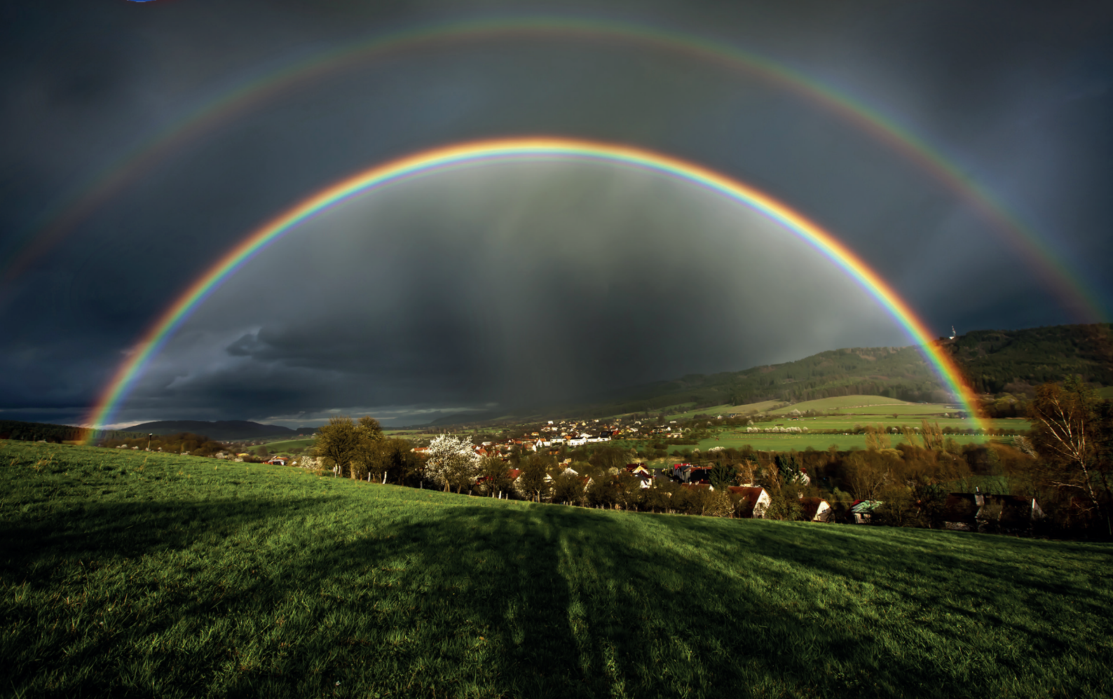
Duha nad Potečí