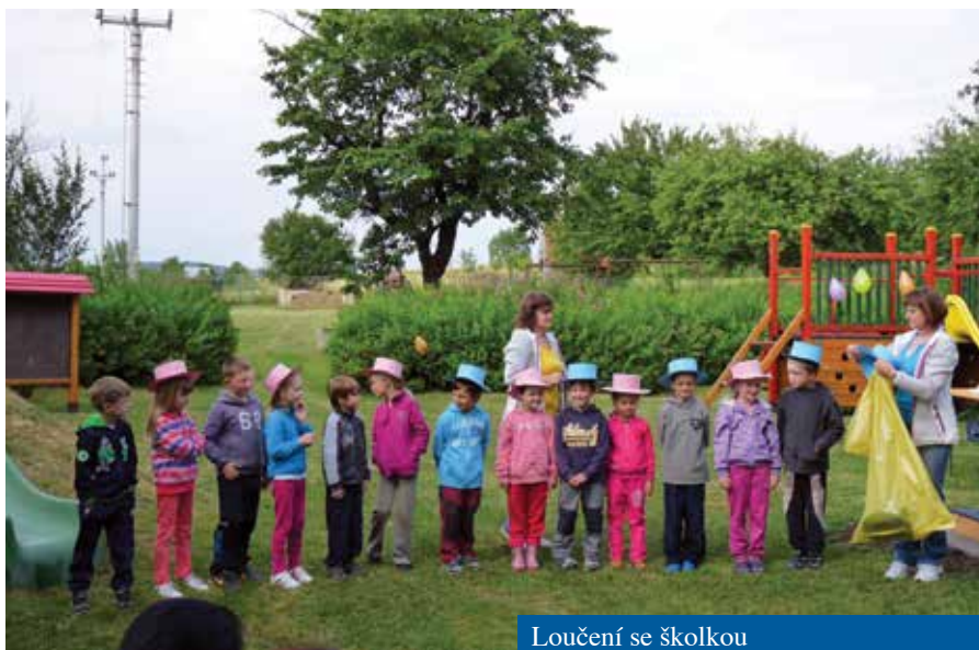
Loučení se školkou

Sudkovec. / Likvidace skládky Úprzlí. / Osvětlení přechodu pro chodce.