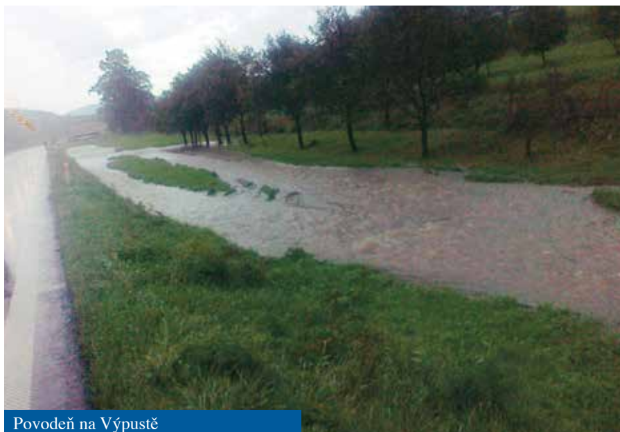
Povodeň na Výpustě