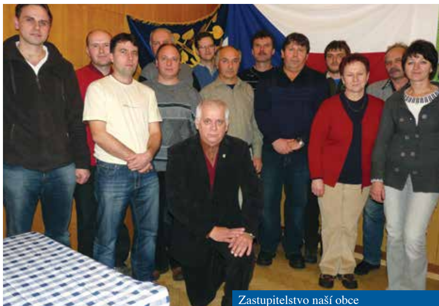
Zastupitelstvo naší obce

/ Rekonstrukce hracích prvků na zahradě MŠ – VPP. / Oprava omítek v kuchyni MŠ – VPP. / Oprava přejezdu v potoku Rakové. / Oprava hřebenové cesty. / Oprava zábradlí u chodníku na Výpustu – VPP. / Houpačky na hřišti pod viaduktem – VPP. / Příčný sběrač na komunikaci u Šudomů. / Rozšíření mostu u tenisového kurtu. / Nový obrázek nad Bartečky. / Rozšíření rozhlasu k Vránom. / Nový příkop u cesty pod Hůstíkem. / Nové nástěnky před OÚ. / Točna na komunikaci Záhumení – Chovanec. / Osvětlení budovy MŠ a OÚ. / Nové zábradlí na mostu Podlání. / Nová smuteční nástěnka + chodník. / Likvidace dřevin na Trhovisku. / Úprava tují před MŠ. / Úpravy na hřišti TJ (kanál, opěrné zdi, elektrika, odvodnění). / Úprava křižovatky Výpusta – prodloužení propustku. / Oprava dětského hřiště před MŠ. / Úprava prostranství kolem obrázku za Bartečky. / Opravy veřejného osvětlení – chodník