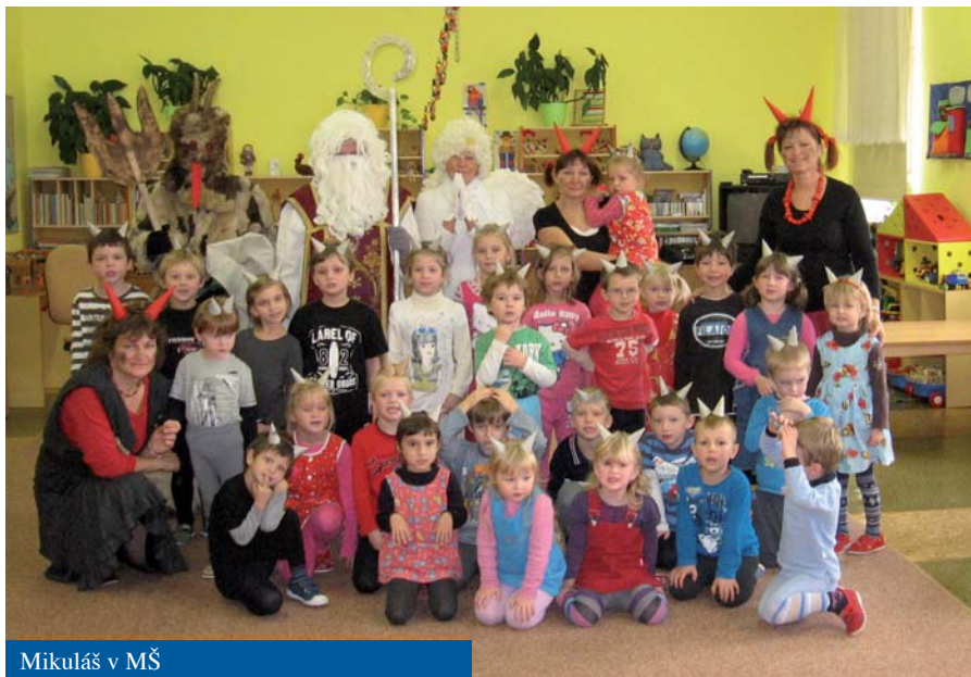
Mikuláš v MŠ

Nevěříte? Opravdu. Děti z Mateřské školy v Poteči se na čertovské besídce pro rodiče změnily na roztomilé čertíky, z kterých nejde strach, ale radost. Po čertovském tanečním vystoupení si se svými rodiči nazdobily perník čerta, který samy ve školce upekly. Ale další den na mikulášské besídce ve školce už měly děti strach, protože do školky přišel opravdovský Mikuláš s Andělem a Čertem – zase dobře spolupracovaly Vesnické ženy, které do čertovského kožichu navlekly místostarostu. Mikuláši jsme zapoměli nasadit čepici, ale dětem se líbil i tak