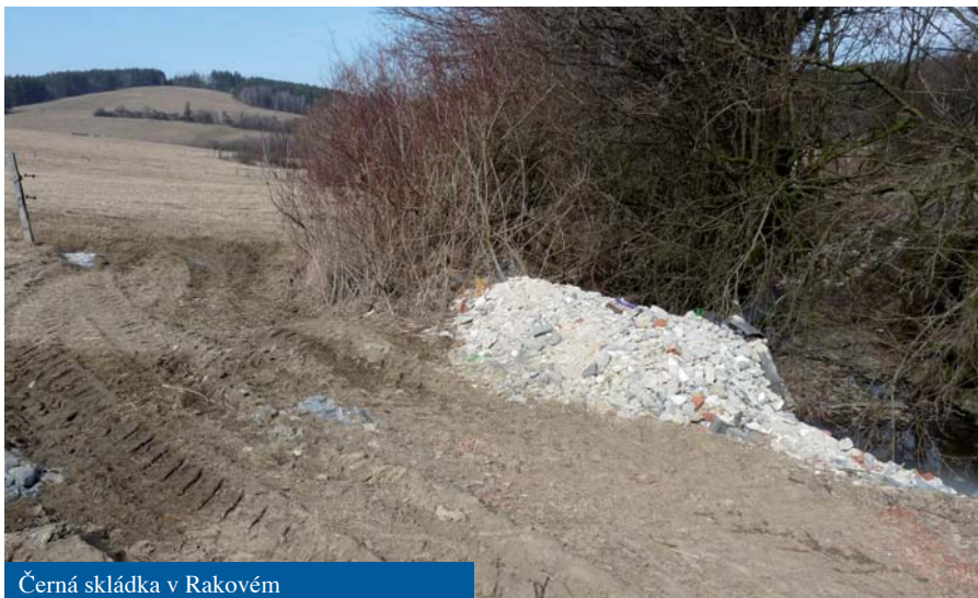
Černá skládka v Rakovém