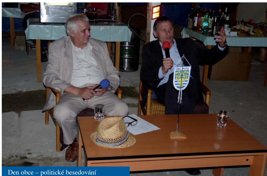
Den obce – politické besedování

• Nabídnutý prodej singulárních podílů v lese za 20 tisíc zastupitelstvo neschválilo.