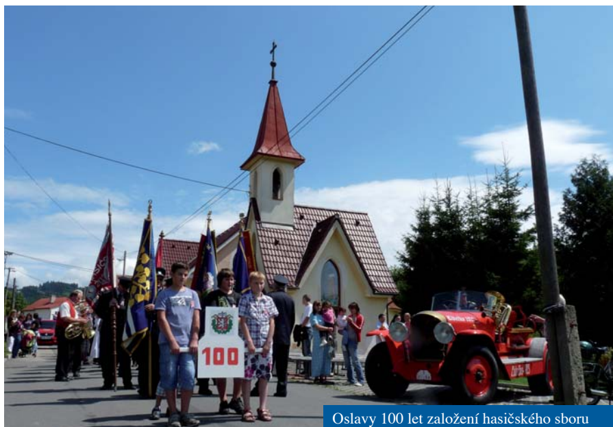
Oslavy 100 let založení hasičského sboru

Využívám příležitosti vydání obecního zpravodaje, abych vás informoval o dostavbě a provozu naší kaple za uplynulý rok.