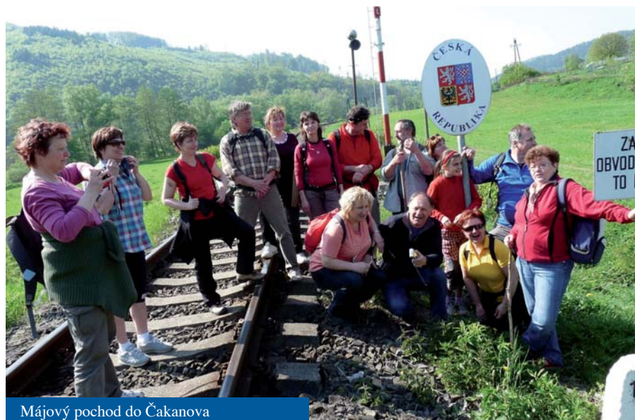
Májový pochod do Čakanova

29. 5. 2011 Májová na Dělanovci – přišlo málo lidí, zřejmě proto, že bylo sychravé počasí. A také současně probíhaly jiné akce. Ale kdo přišel, nelitoval, odnesl si domů duchovní zážitek.