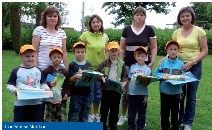
Loučení se školkou