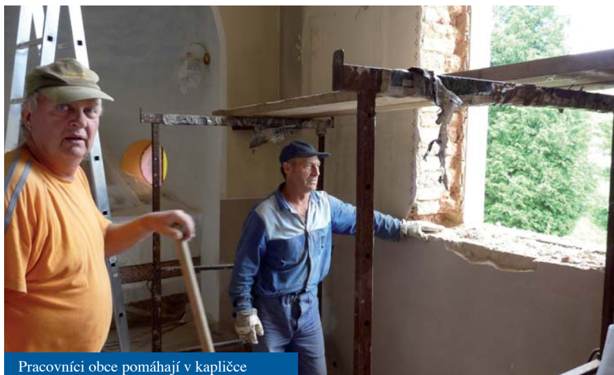
Pracovníci obce pomáhají v kapličce