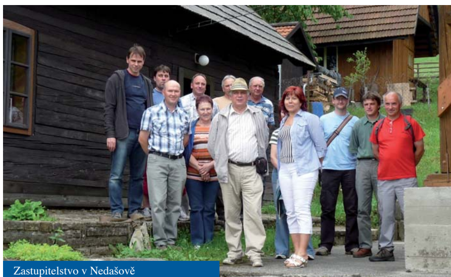
Zastupitelstvo v Nedašově