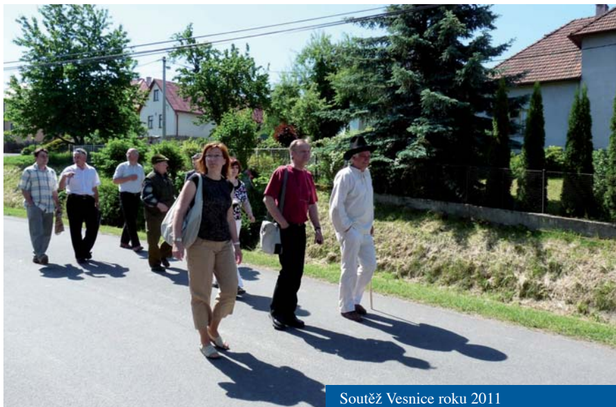
Soutěž Vesnice roku 2011

• Audit-kontrola hospodaření obce za rok 2010 byl bez výhrad a zastupitelstvo mohlo schválit závěrečný účet obce.