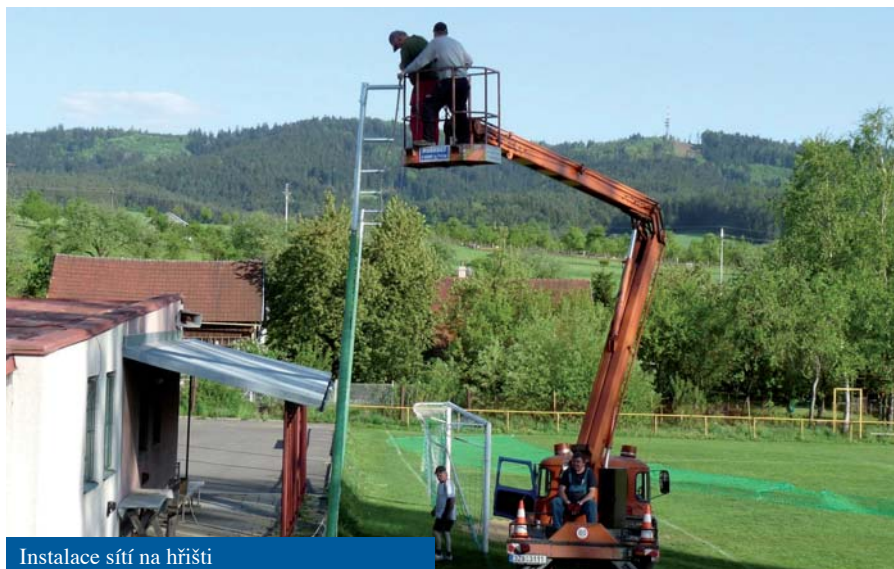
Instalace sítí na hřišti