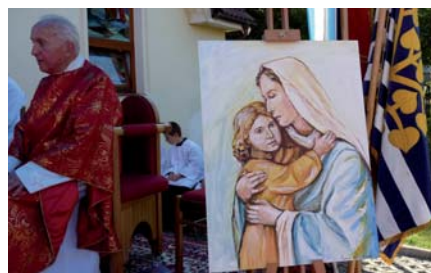
Hody - požehnání obrázku

Od května roku 2009 již zdárně funguje běžný liturgický program, a tak kaple má také své provozní náklady. Za plyn jsme zaplatili v letošním roce 18.670 Kč, za elektřinu 5.700 Kč a za vodné 228 Kč. Další náklady na údržbu, úklidové prostředky, drobné zboží a služby činily