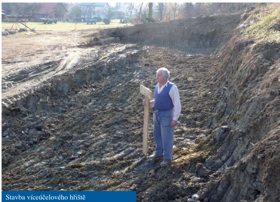
Stavba víceúčelového hřiště

Stavba víceúčelového hřiště, vtipně nazývané "hřiště u hřiště", dostalo v zastupitelstvu prioritní a příprava stavby byla upřednostněna. Hřiště bude mít umělý povrch o velikosti 42x21m s vybavením na malou kopanou, tenis, volejbal, nohejbal, házenou, košíkovou, streetbal a lední hokej – na ploše se dá udělat v zimě led. Celkové rozpočtované náklady jsou 4 miliony. Stavba byla povolena v říjnu veřejnoprávní smlouvou, příprava území byla zahájena v listopadu a v příštím roce bude ve výběrovém řízení vybrána firma a stavba by mohla být zrealizována. Na stavbu se snažíme získat dotace z programu Ministerstva školství ČR a prostřednictvím MAS Ploština. Věřím, že po dostavbě bude hřiště hojně využíváno hlavně mládeží.