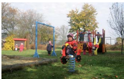
Nové hřiště na zahradě MŠ

Nevěříte? Opravdu. Děti z Mateřské školy v Poteči se na čertovské besídce pro rodiče změnily na roztomilé čertíky, z kterých nejde strach, ale radost. Po čertovském tanečním vystoupení si se svými rodiči nazdobily perník čerta, který samy ve školce upekly. Ale další den na mikulášské besídce ve školce už měly děti strach, protože do školky přišel opravdovský Mikuláš s Andělem a Čertem – zase dobře spolupracovaly Vesnické ženy, které do čertovského kožichu navlekly místostarostu. Mikuláši jsme zapoměli nasadit čepici, ale dětem se líbil i tak