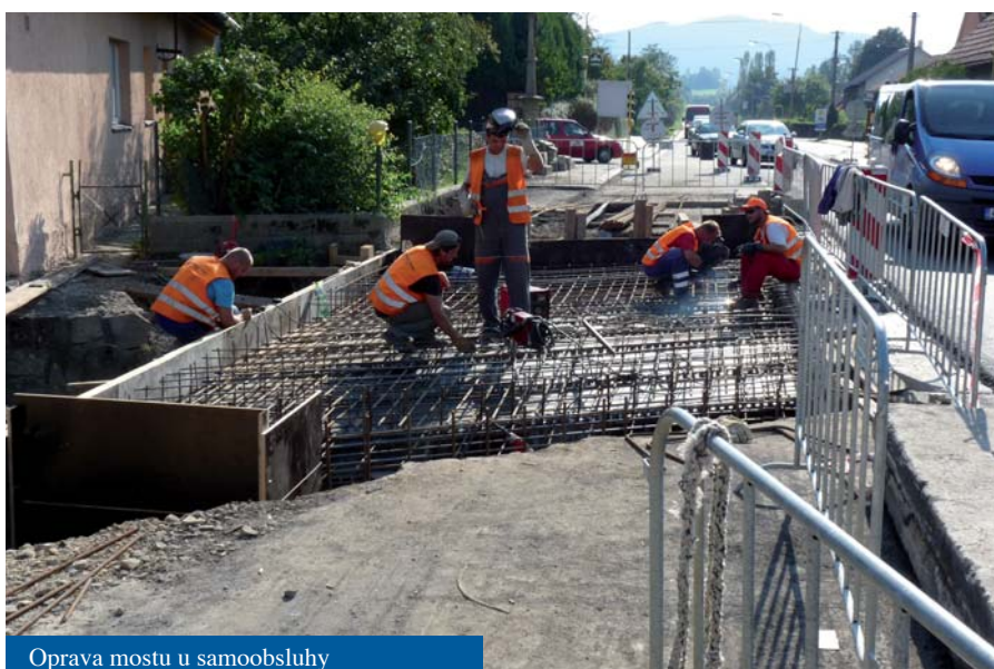
Oprava mostu u samoobsluhy

Zkratka RUD znamená rozpočtové určení daní , které stanovuje, jak se vybrané daně rozdělují mezi stát, kraje a obce. Hnutí starostů a nezávislých začalo bojovat proti daňové diskriminaci obcí a za nalezení spravedlivějšího systému rozdělování. Po bližším seznámení zjistíte, že rozdělování mezi města a obce, která nás nejvíce zajímá, se děje podle počtu obyvatel a koeficientu. Čtyři největší města Praha, Brno, Ostrava a Plzeň mají pouze 20% obyvatel, ale získávají polovinu peněz určených obcím a městům. V okolních státech Evropy mají velká města v průměru 2,5x větší podíl z rozdělova-