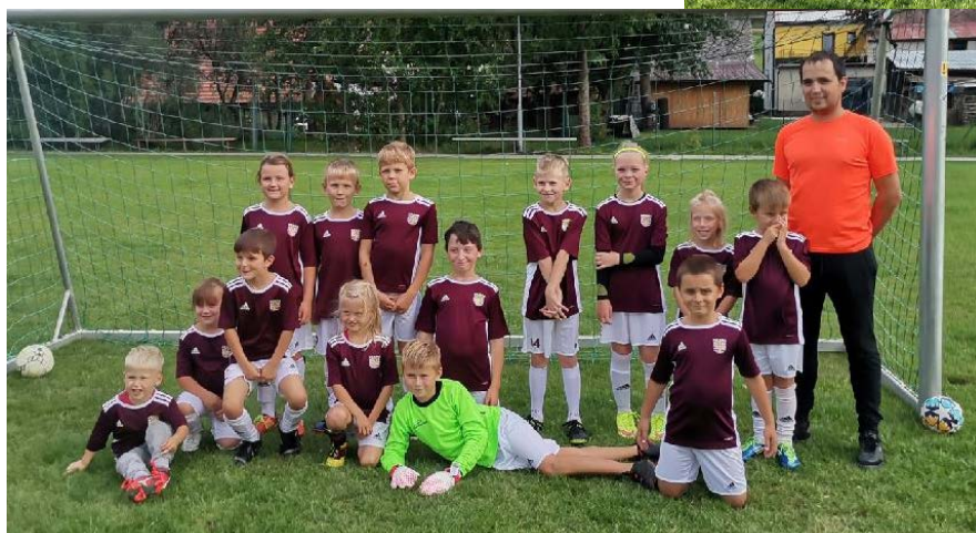
FK Poteč přípravka

děti. Proto jsme je rozdělili na přípravku a žáky. Přípravka odehrála pár přípravných utkání a seznamovala se s fotballem.