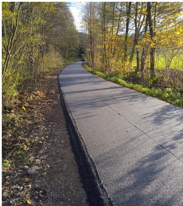
Oprava cesty svážnice