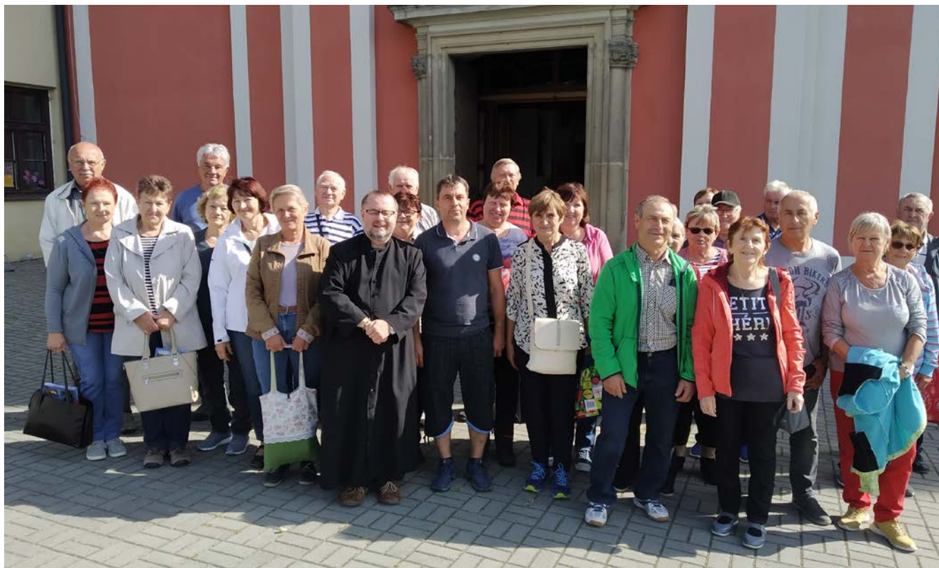
Zájezd pro důchodce