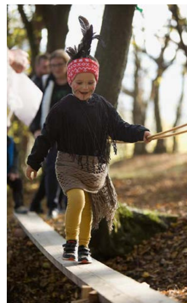
Přechod přes kaňon