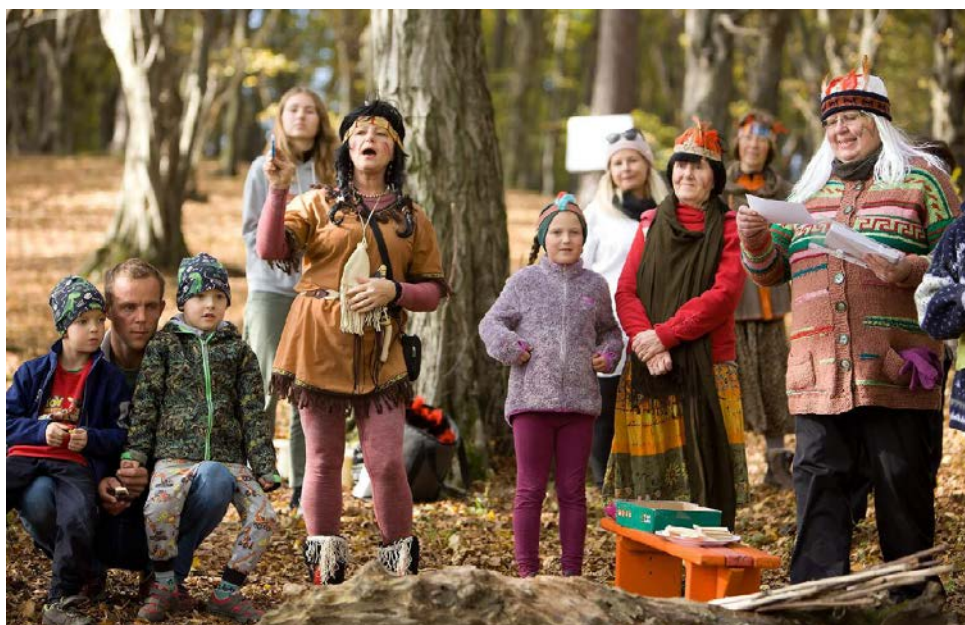
Indiánská osada Hrábí

Ve čtvrtek 24.11. jsme se sešly při Kateřinské besedě. Uspořádaly jsme