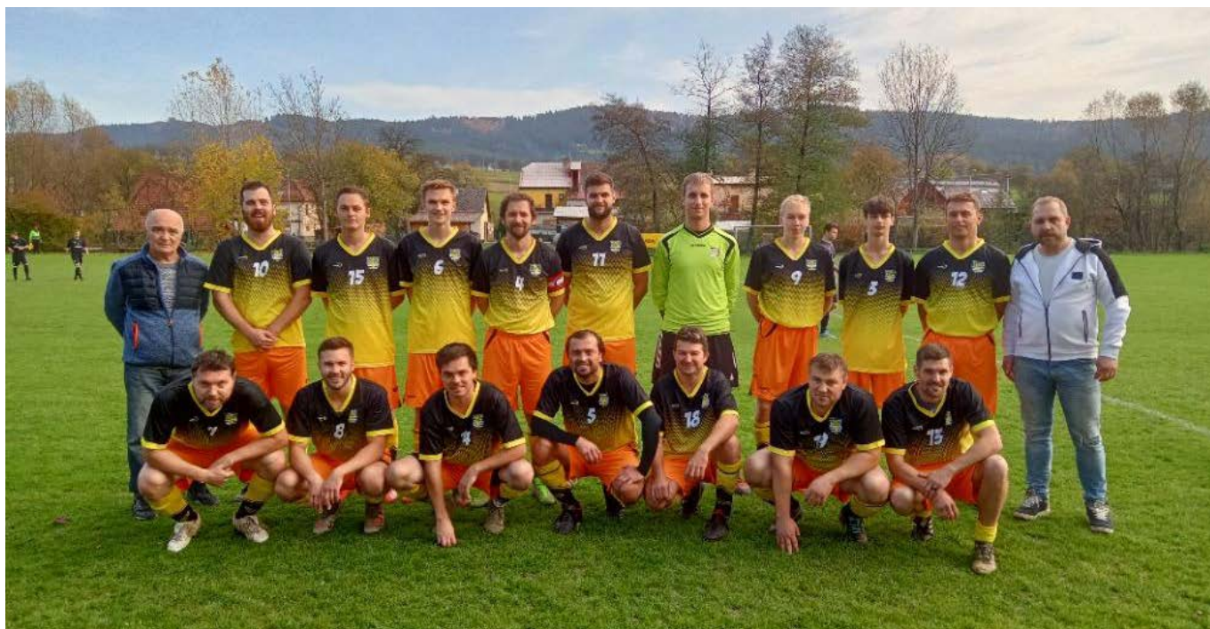
FK Poteč muži