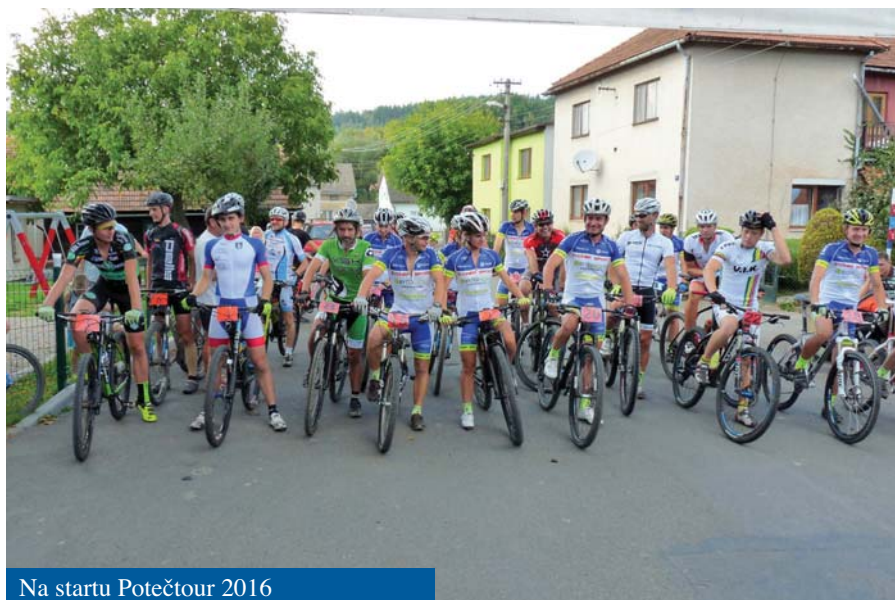
Na startu Potečtour 2016