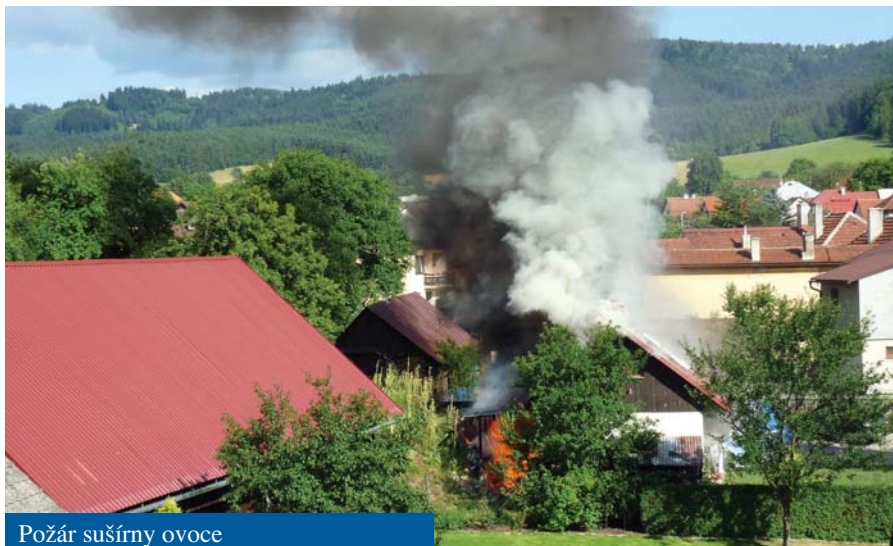
Požár sušárny ovoce

• Obec podporuje různé společenské akce jako je kácení máje, dětský den, noční hasičskou soutěž, pouliční turnaj v kopané, turnaj ve stolním tenisu, potečtůr, potečské hody, památka zesnulých, vánoční akce a další.