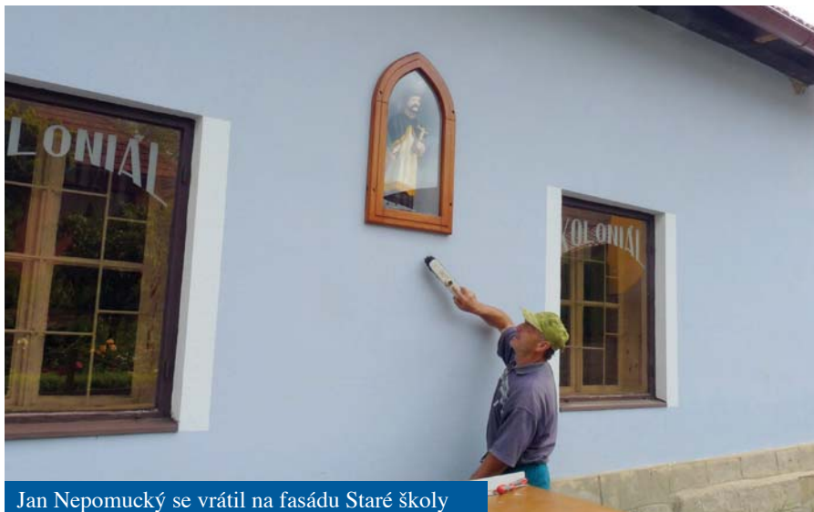
Jan Nepomucký se vrátil na fasádu Staré školy

Tato otázka mně trápí a zatím jsme nenalezli řešení. Náš původní záměr byl udržet v této budově obchod se základními potravinami, ale toto se nám nepodařilo. Do budovy je přivedena elektřina, plyn, vodovod a odpady jsou napojeny na splaškovou kanalizaci. Opravili jsme také střechu a už zbývá jenom do budovy vrátit život. Společně se zastupitelstvem budeme i nadále hledat pronájem nebytových prostor pro možné uplatnění, a nebo jiné vhodné využití. Kdybyste měli