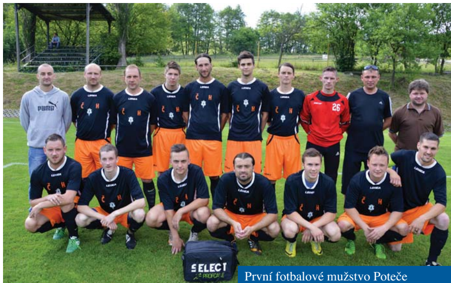
První fotbalové mužstvo Poteče

„Na inventuře jsme zjistili, že kuchařka má všechny nože tupé!“ Ředitelka jídelny vysvětlila: „Už jsem nechala všechny nože nabrousit tak, že mám všechny prsty pořezané!“