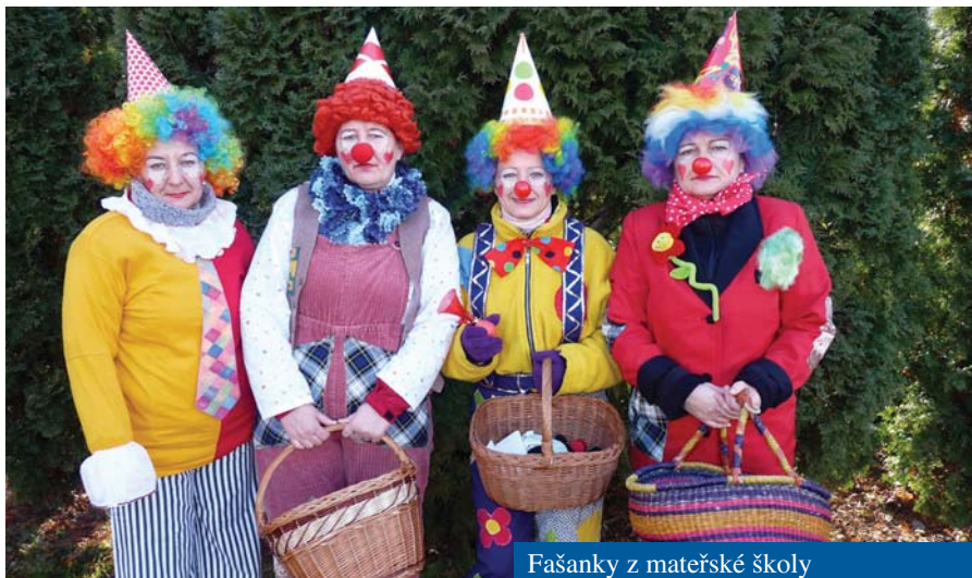
Fašanky z mateřské školy