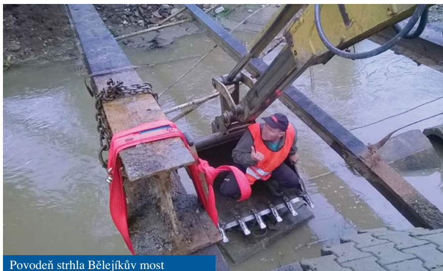
Povodeň strhla Bělejčkův most