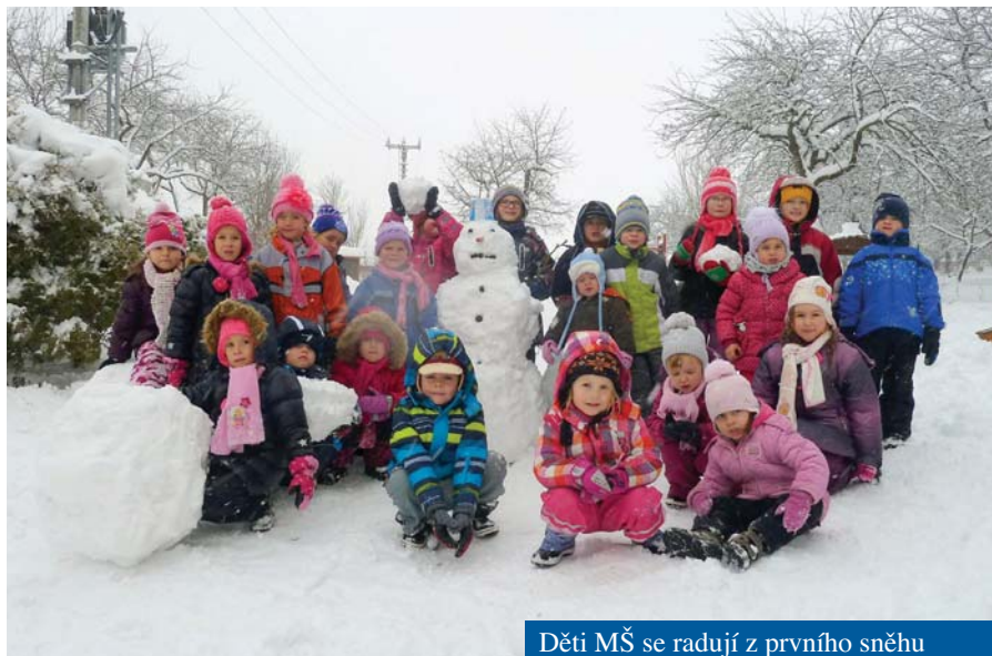
Děti MŠ se radují z prvního sněhu

Při obědě: Chlapeček říká: „Paní učitelko, já ten okurek nesmím, mám z toho vyrážku.“ Po chvíli dostane na okurek chuť: „Já ten okurek radši sním, šak mám na to mastičku.“