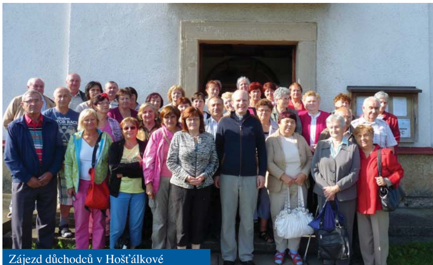
Zájezd důchodců v Hošťálkové

Spotřebovali se 3 divočáci a 22 kg srnčího masa. Bylo připraveno 140 porcí guláše a 200 porcí pečeného masa se zelím a knedlíky. Fronta u masa byla jak „fronta na maso“. Lidi si brali plné konvíčky i sebou domů. Vypily se 3 bečky piva, protože bylo tropické počasí 30 stupňů. Přišlo také hodně cizích lidí, ti to