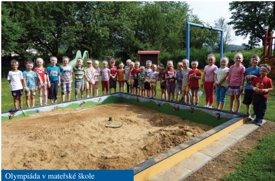
Olympiáda v mateřské škole