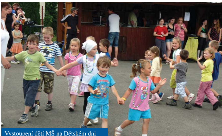
Vystoupení dětí MŠ na Dětském dni