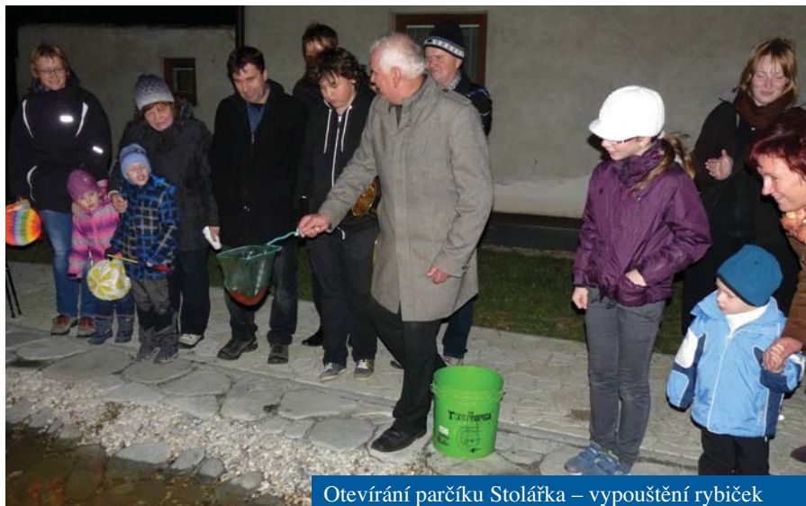
Otevírání parčíku Stolářka – vypouštění rybiček

• Pracovníci CHKO Bílé Karpaty přesvědčovali zastupitele o rozšíření přírodní rezervace Ploštiny. Byla sjednána a proběhla i obchůzka. Na Obecním lázu roste vysoká tráva, terén je podmáčený a nikdo jej nechce uklízet. Při jednání se ukázal rozpor mezi vyhlášeným a zakresleným územím rezervace.