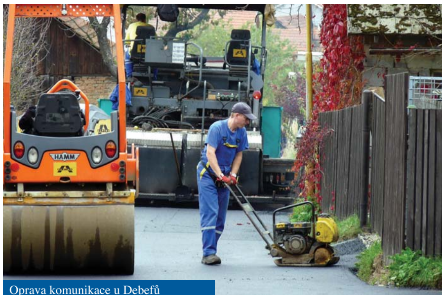
Oprava komunikace u Debefů

• Michal Dorňák pořádal na rybníku Extremendurocross a pan Zůbek se obával o život papoušků na Trhovisku.