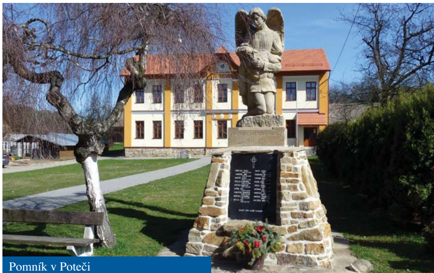
Pomník v Poteči