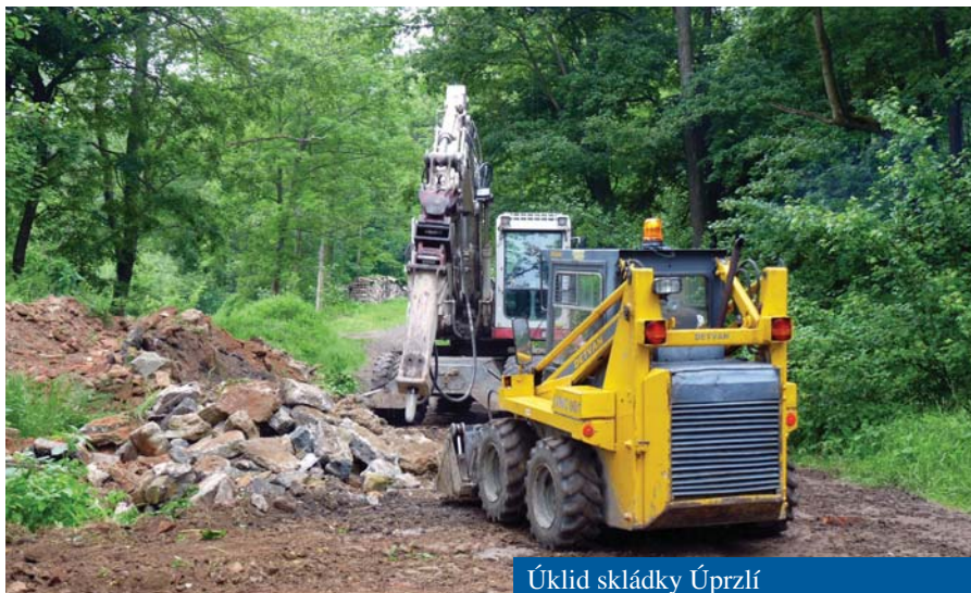
Úklid skládky Úprzlí

• Starosta s manželkou se osm dní školili, jak mají vychovávat děti.