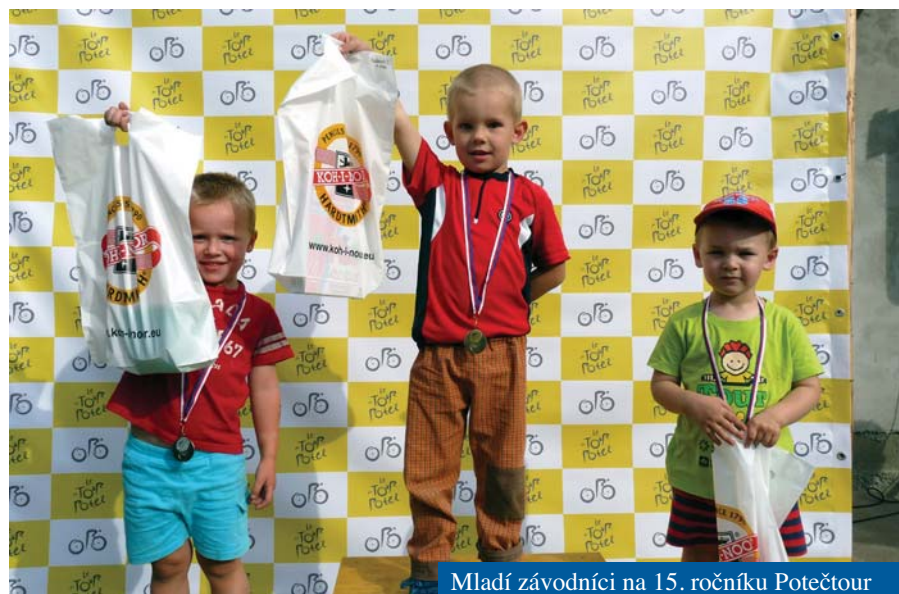
Mladí závodníci na 15. ročníku Potečtour