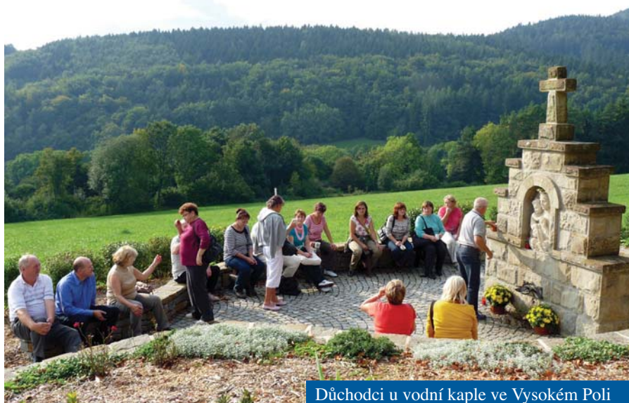
Důchodci u vodní kaple ve Vysokém Poli