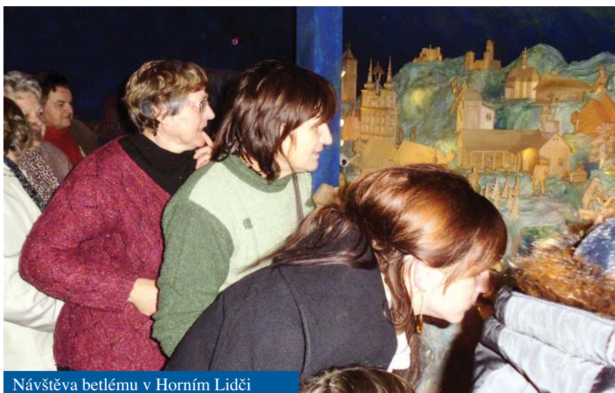
Návštěva betlému v Horním Lidči