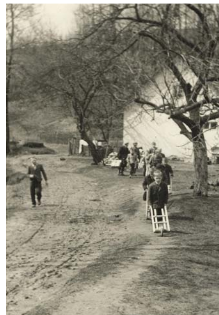
Ščukotání pod Hůštíkem v 60. letech