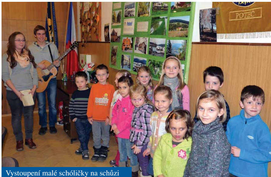
Vystoupení malé schůličky na schůzi