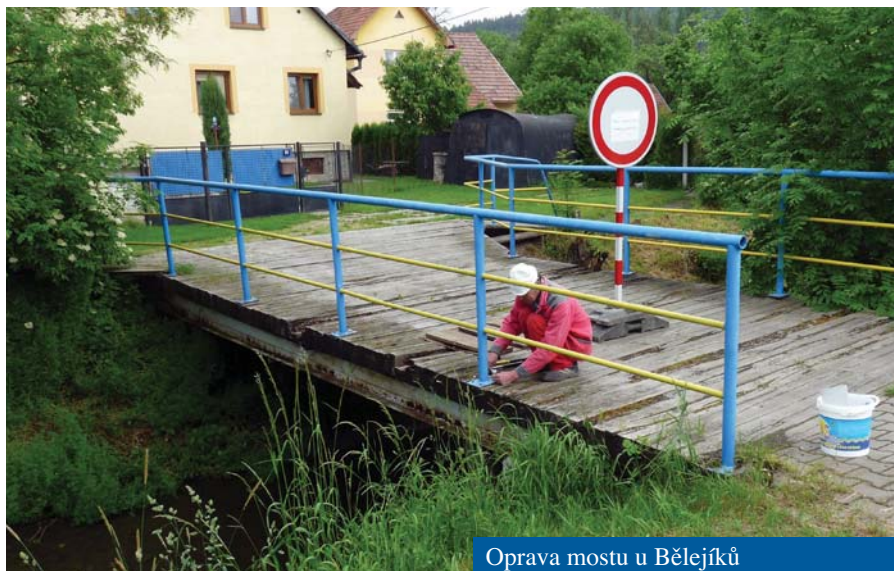
Oprava mostu u Bělejšků

Oprava omítek, podlahy a výmalba skladu hraček na dvoře mateřské školy • Prořezání starých stromů ve školní zahradě • Údržba sběračů vody • Sezonní údržba veřejné zeleně a cest • Oplocení vyústění potoka v horňansku pod dráhou • Prořezání stromů u kříže před obecním úřadem, nad dráhou u mostu, a na Podlání • Zřezání stromů kolem Bělejovy dřevěnice • Přesazení dvou větších lip u Bělejovy dřevěnice a na podlání • Pomocné práce na přestavbě Valčíkového domu a garáží • Výroba dřevěnné houpačky u Koloniálu • Osazení a zabetonování kolotoču pod dráhou • Montáž dvou silničních zrcadel u Jurků • Pomoc s přípravou kácení máje na točně • Montáž a kotvení nového houpadla v zahradě mateřské školy • Příprava podkladu na nové pískoviště v zahradě MŠ • Vysečení a úklid na Dělanovci před květnovou májovou a výroční mší sv. v srpnu • Pomoc s obalováním knih v obecní knihovně • Příprava poutě u Cyrilky • Přestavba mostu, úprava a nátěr zábradlí u Bistrých • Příprava akce Politické besedování • Úprava kolem pomníku v Březině • Příprava hodů na Svatého Václava • Montáž nového obrázku na Lůkách.