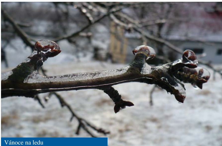
Vánoce na ledu