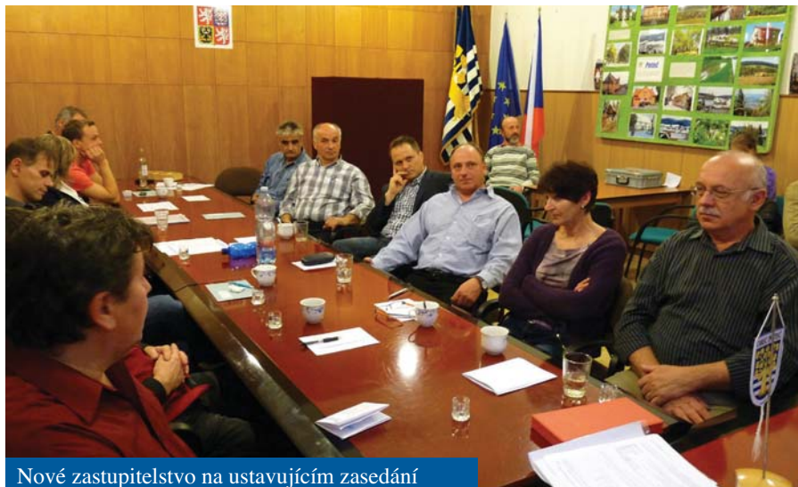
Nové zastupitelstvo na ustavujícím zasedání

ukradený hrncel elffího zlata. Příběh se proměnil v komedii o českých emigrantech hledajících v Americe štěstí a bohatství. V patách Josefu Maršálkovi a jeho dceři Káci přitom není okradený skřítek Leprikorn, ale vodník Čochtan. Na dobré náladě mají podíl i známé písně, jako třeba Jampak je dnes u nás doma, Tam za tou duhou, S čertem si hrát a další. Příběh hrálo 14 herců a z Poteče jel plný autobus lidí, vstupenka stála 210 korun.