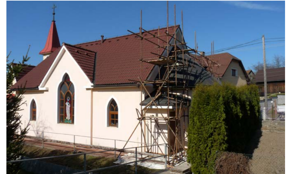
Zateplení kaple svatého Václava

Myslím, že nově opravené sociální zařízení nabídne větší komfort návštěvníkům obecního úřadu při různých společenských akcích a setkáních. Výše popsané opravy budou představeny při kulturní akci – letní kino, pokud to dovolí situace.