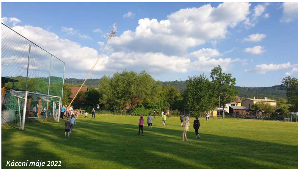
Kácení máje 2021