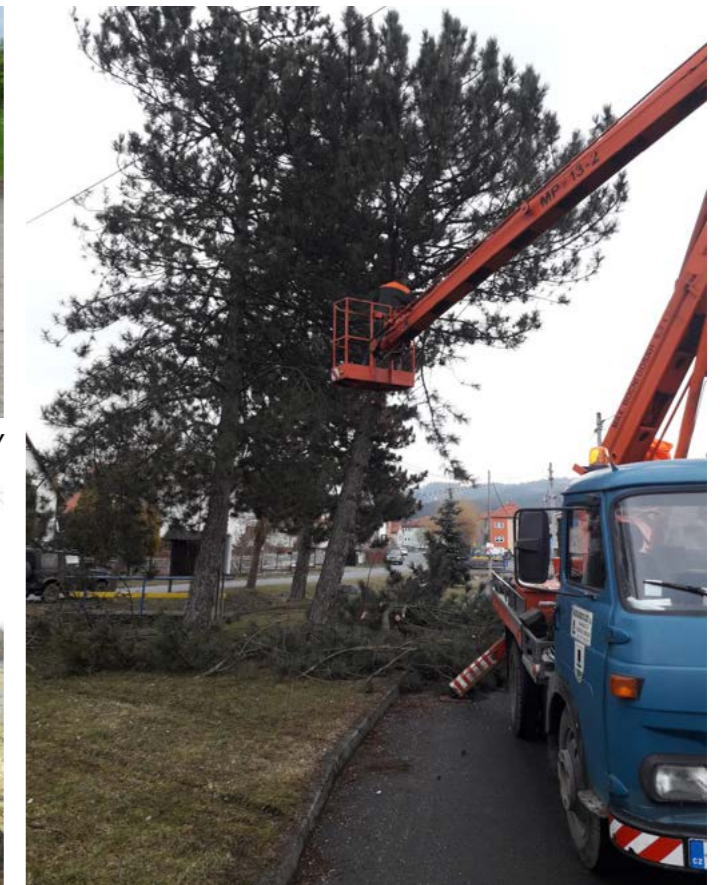
Pokácení borovice u točny