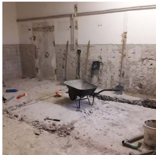
Opravy v budově obecního úřadu- před