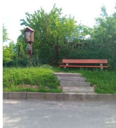
Opravené schody u obrázku

/ Povodí Moravy opravilo ujíždějící břeh potoka pod farmou. Toto bránilo prodloužení chodníku od Špalků po farmu. Pokračujeme v přípravě této stavby.