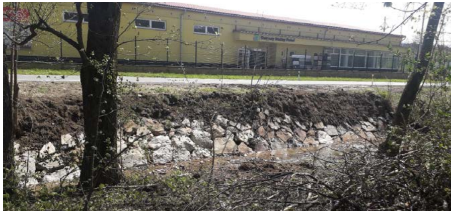
Povodí Moravy opravilo ujíždějící břeh

/ Schody u obrázku na Nádevsí, byly dočasně opraveny. Neznámý řidič (vandal) je totiž kolem Vánoc poničil a nebyl schopen dát do původního stavu. S větší opravou tohoto odpočinkového místa raději počkáme a kompletně renovujeme až po vybudování kanalizace a vodovodu, či případné realizaci plánovaných rodinných domů.