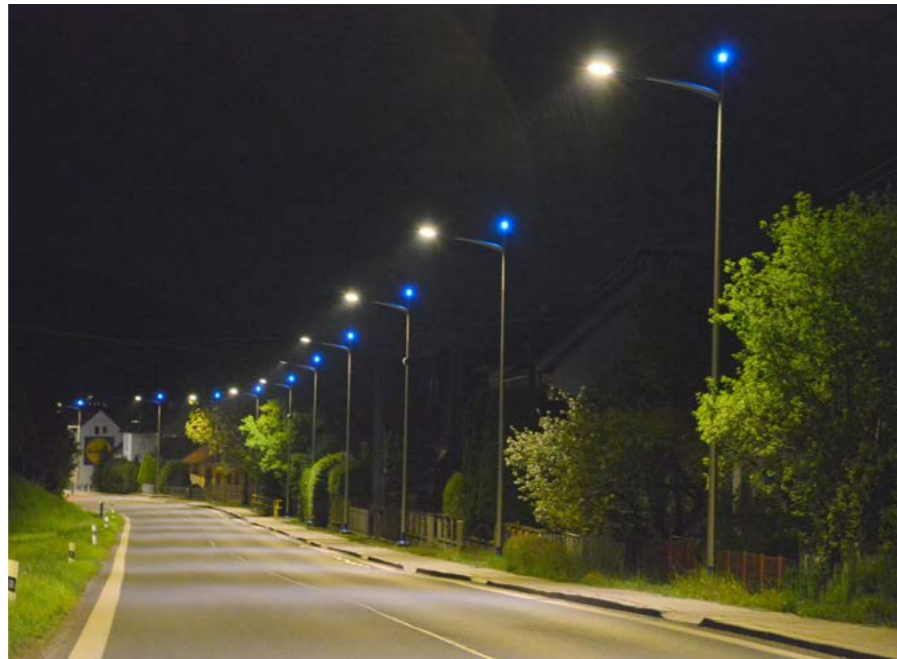
Nové veřejné osvětlení

Koncem měsíce dubna byla úspěšně dokončena oprava veřejného osvětlení hlavní silnice 1/57. Oprava zahrnovala instalaci nových kabelových rozvodů, sloupů a nové led světla. Ozdobou osvětlení jsou modré poziční svítící koule na vrcholu sloupů. Modrou barvu jsme zvolili, jako jednu z barev obecního znaku. Hlavní silnice je opravdu krásně nasvícená a světla mají příjemnou barvu. Oprava nás vyšla na 2,7 milionu korun a provedla ji firma ELCOMAT s.r.o. Předmětem další drobné opravy tohoto úseku bude osvětlení přechodu pro chodce u rybníčku, kde zůstal provizorně starý sloup s jednou lampou. Nové osvětlení přechodu by mělo být oboustranné se dvěma světly podle nové normy.