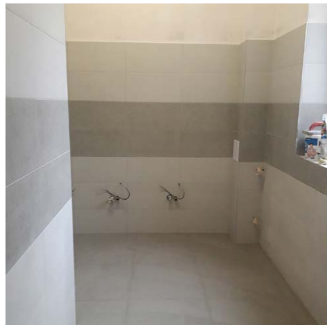
Opravy v budově obecního úřadu- další fáze