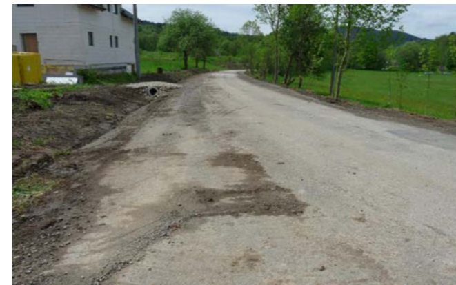
Cesta u Holubářky

/ U točny jsme pokáceli jednu ze dvou borovic. Byla příliš nahnutá a její šišky komplikovaly chůzi po komunikaci.