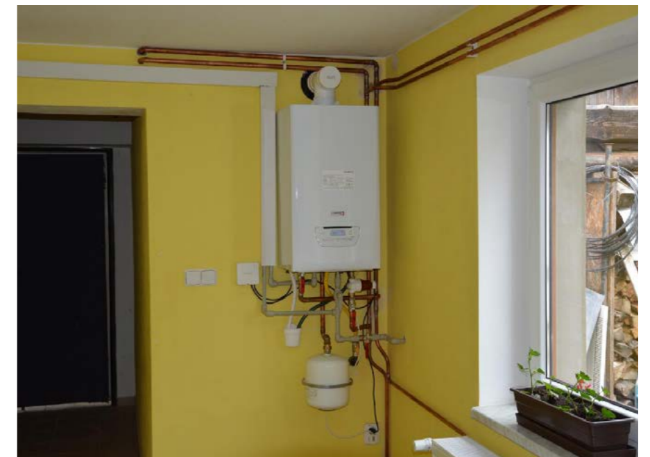
Obecní dům Valčíkovo