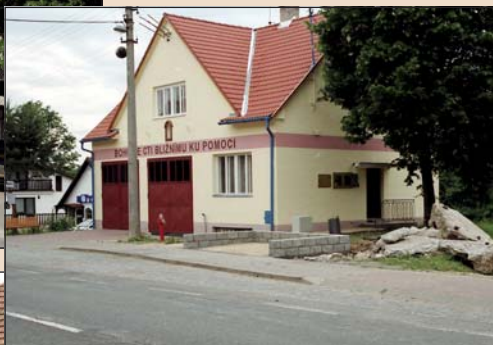
2001 – Nátěr fasády zbrojnice a opravená fasáda k 90. výročí