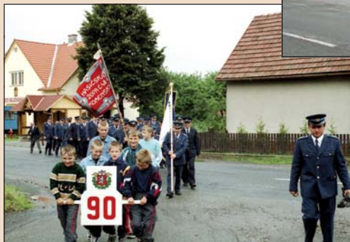
2001 – Hasiči 90 let – průvod