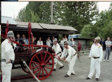
2001 – Oslavy 90. výročí založení