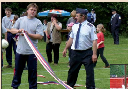
2008 – Okrsková soutěž v Mirošově