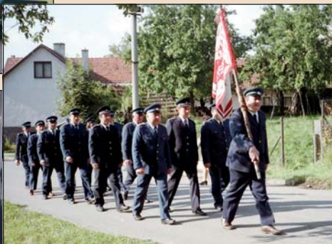
Hasiči pochodují na slavnostní sv. mši