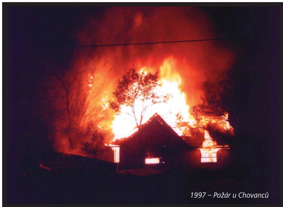
1997 – Požár u Chovanců