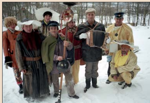
1998 – Fašanky – skupina Dolňansko