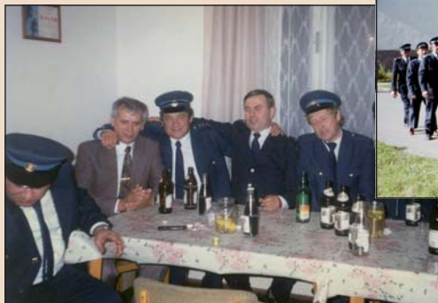
1996 – Hasiči se starostou obce slaví posvěcení obecního praporu a nové stříkačky.