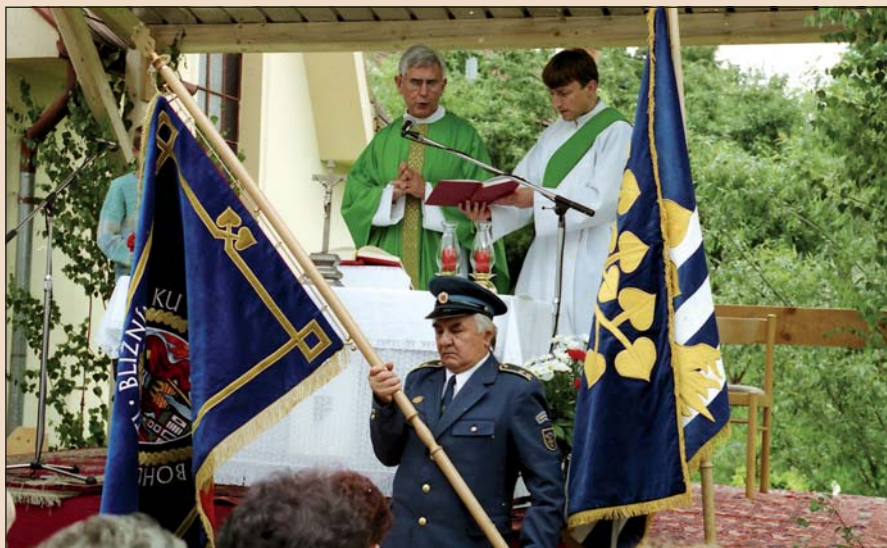
2001 – Posvěcení praporu hasičů