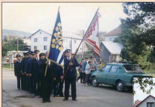
1996 – Hasiči odnášejí posvěcený obecní prapor a prapor okrsku.