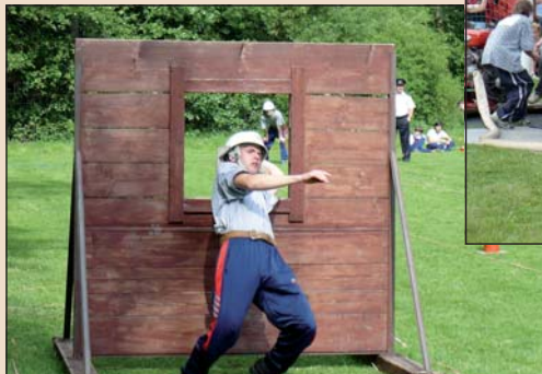
2008 – Okrsková soutěž v Mirošově