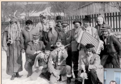
1992 – Fašanky