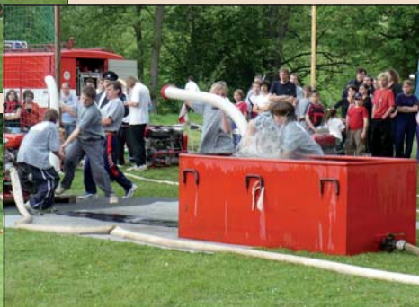
2008 – Útok žáků na okrskové soutěži v Mirošově