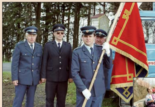
2002 – Hasiči na sv. Hostýně