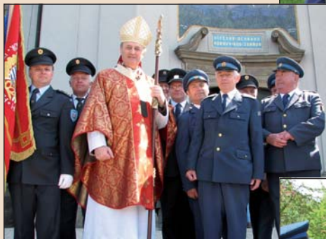
2009 – Hasiči na svěcení kaple sv. Václava