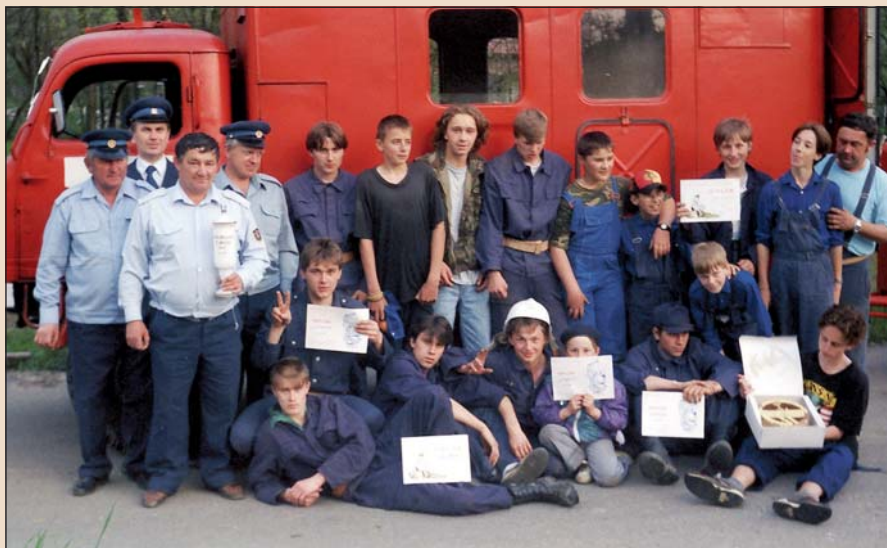
1996 – Vítězný návrat z Mirošova