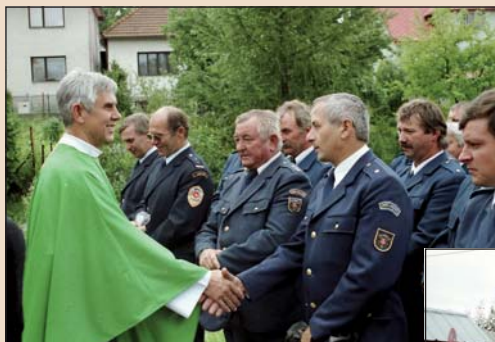
2001 – Hasiči na slavnostní sv. mši