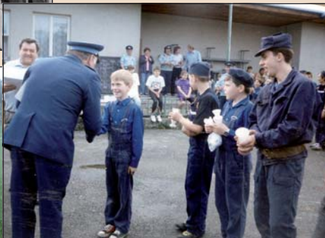
1995 – Okrsková soutěž