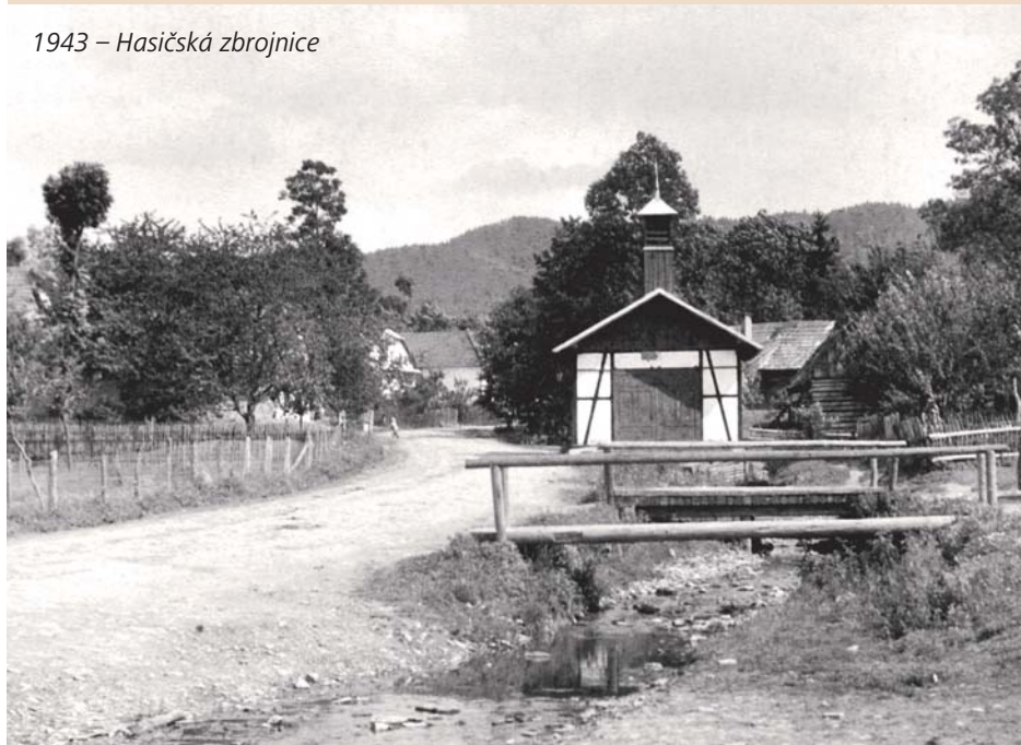
1943 – Hasičská zbrojnice