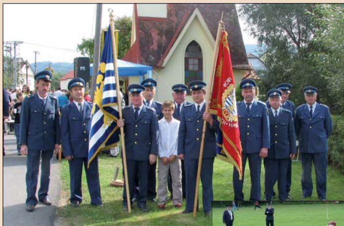
2005 – Oslavy v Poteči

2005 – Přes veškeré úsilí pouze 5. místo