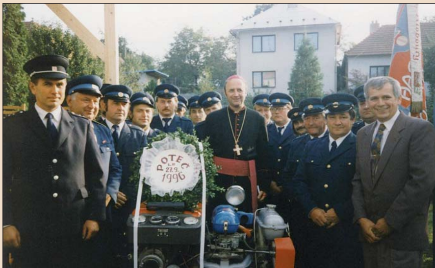
1996 – Svěcení nové stříkačky