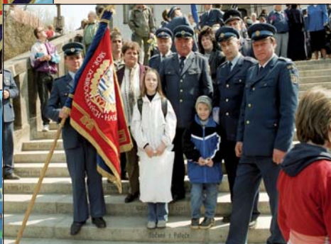
2003 – Na schodku od občanů z Poteče